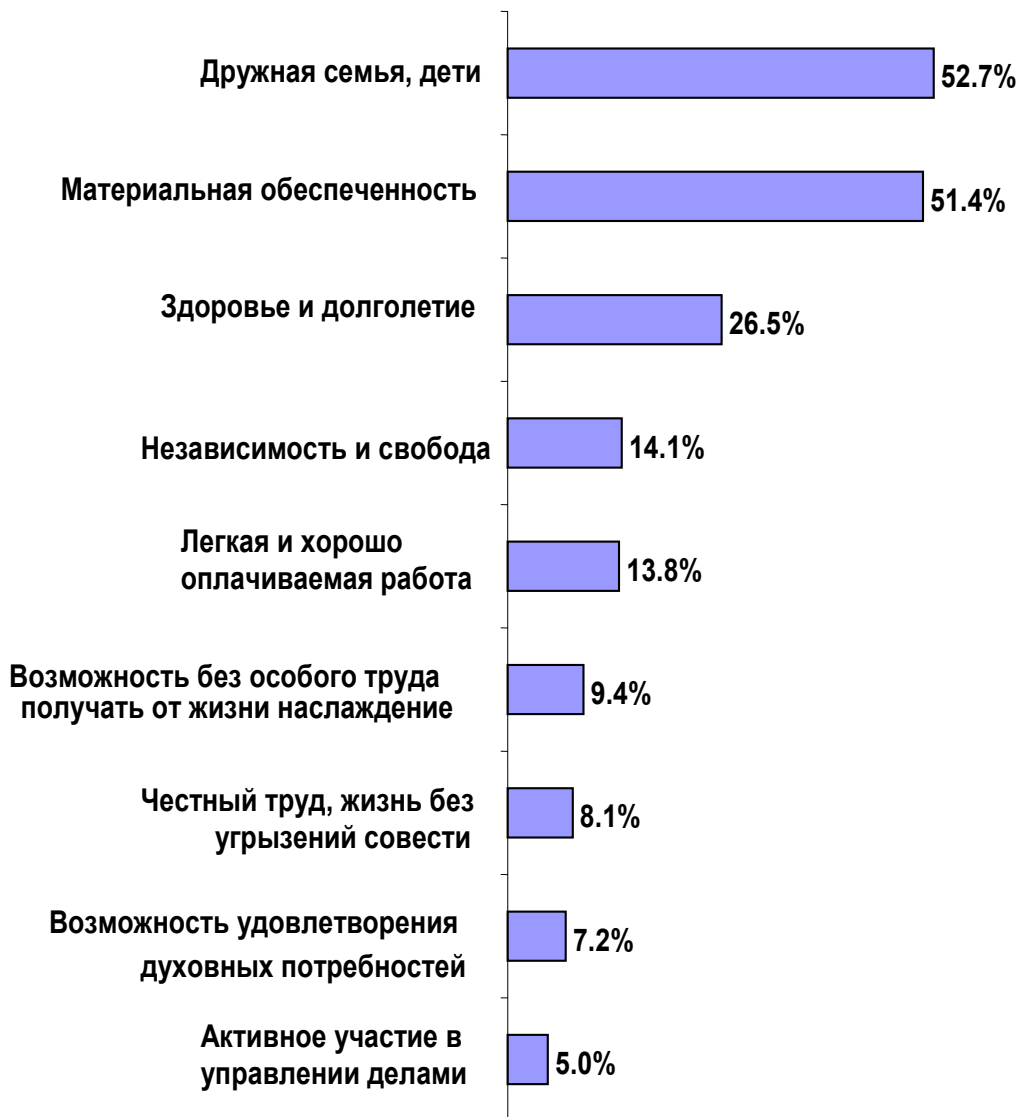
Рис. 3. Діаграма структури життєвих цінностей молоді Запорізької області

Але ж якщо розглядати та аналізувати окремо сімейні та дітородні орієнтири як базові цінності молоді сьогодення, то дуже помітно, що найважливіша цінність для молоді є сім'я, а дітородні цінності розглядаються як те що робить сім'ю повноцінною (64%), являє собою смисл життя батьків (47%) та з'єднує родину (41%). І лише 34% вважають, що діти це основний сенс сімейного життя (діаграма 4).