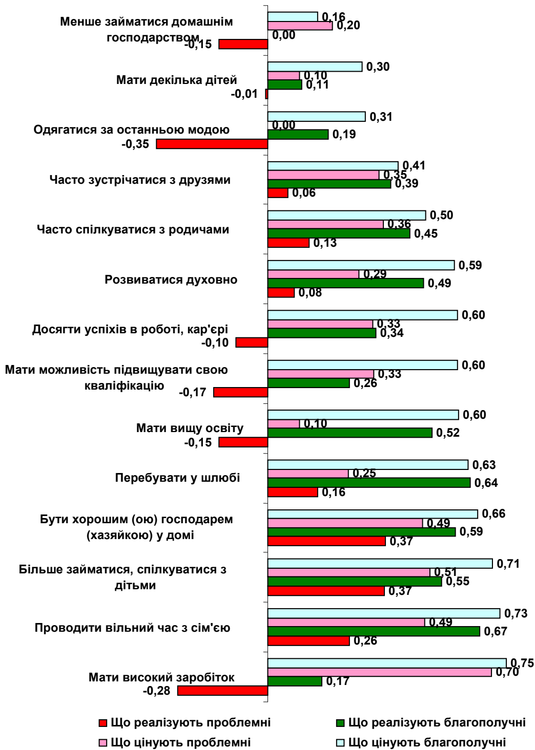
Рис. 1. Діаграма середніх коефіцієнтів значущості цінностей та їх реалізації у опитаних із благополучних та проблемних сімей (коефіцієнт може набувати значення від -1 до 1)