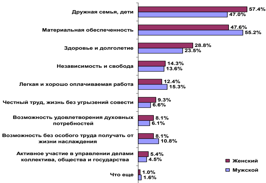
Діаграма 3. Структура життєвих цінностей молоді Запорозької області в залежності від пола

Спираючись на ціннісні орієнтири, молодь формує представлення про «добре життя», асоціює його з дружною родиною, дітьми (52,7%), матеріальним забезпеченням (51,4%) та здоров'ям (26,5%).