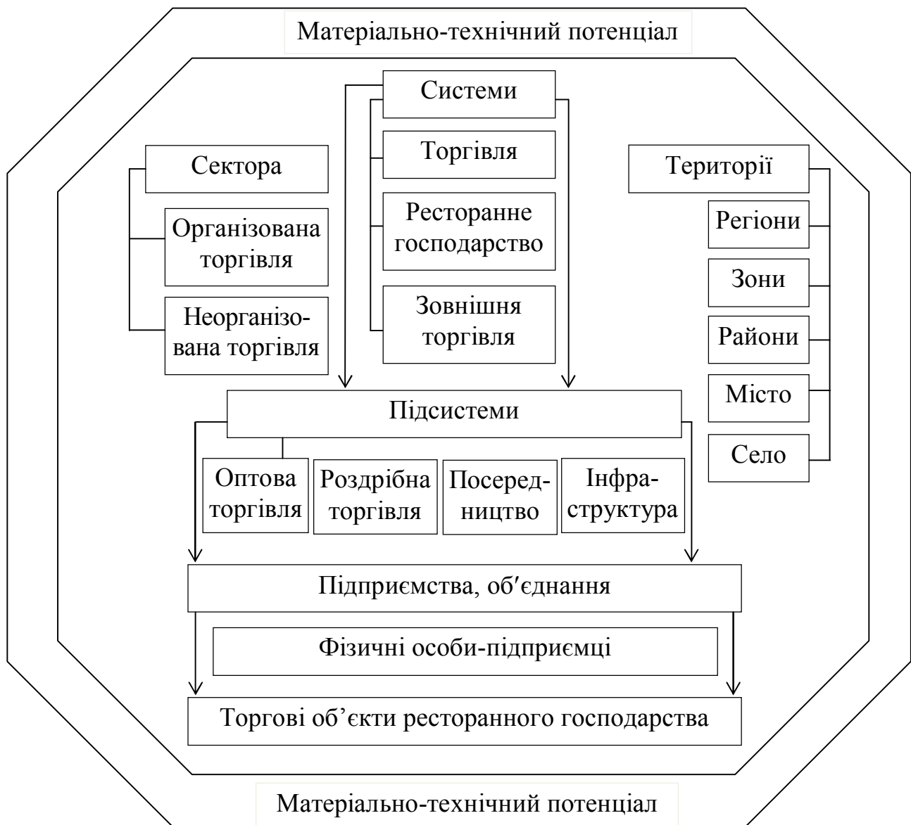
Рисунок 2 – Розміщення ресурсів матеріально-технічного потенціалу сфери товарного обігу

Висновки та перспективи подальших досліджень. Проведене дослідження показало, що матеріально-технічний потенціал є взаємозалежним і тісно взаємодіє з іншими видами потенціалів сфери товарного обігу.