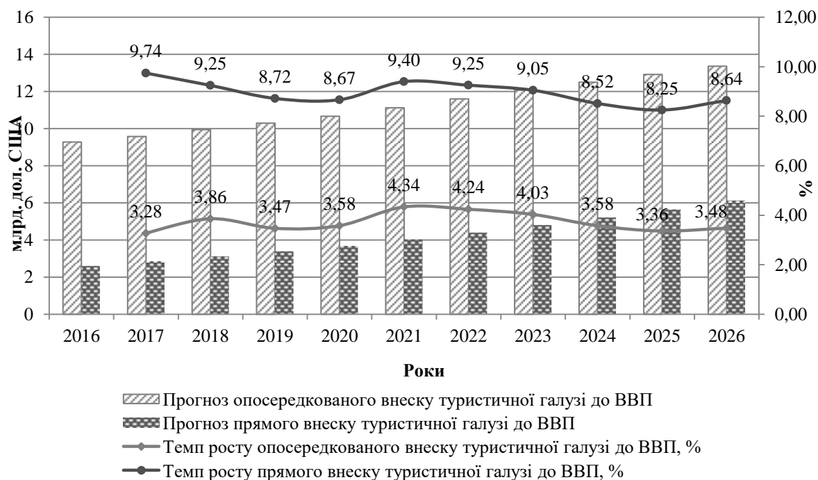
Рисунок 3 – Прогноз внеску туристичної галузі України до ВВП, 2016–2026 рр.

Ключовим показником впливу туристичної галузі на соціально-економічний розвиток є внесок туристичної галузі України до ВВП (рис. 3).