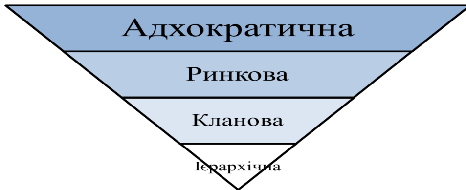
Рисунок 4 – Ієрархія типів організаційних культур підприємницької структури щодо узгодженості економічних інтересів суб'єктів її середовища господарювання.