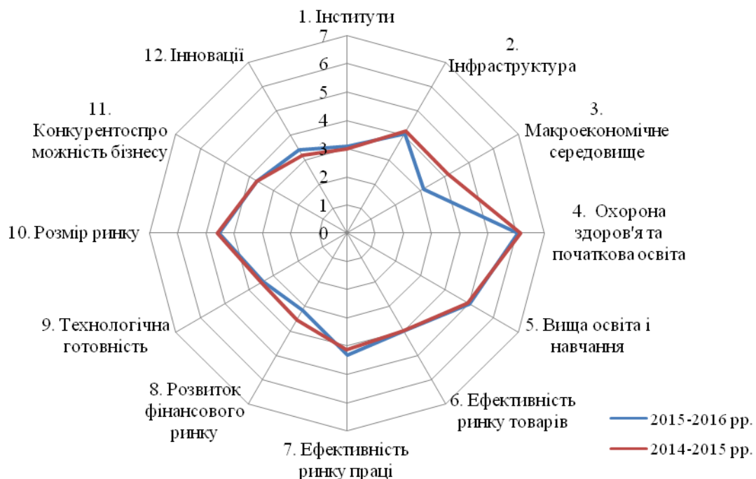
Рисунок 2 – Індекс глобальної конкурентоспроможності України за 2015–2016 рр. та 2014–2015 рр.

Основними факторами, які не дають країні опинитись у верхніх позиціях рейтингу є недостатня конкурентоспроможність фінансових ринків, макроекономічного середовища та неефективність інституційного середовища (рис. 2)