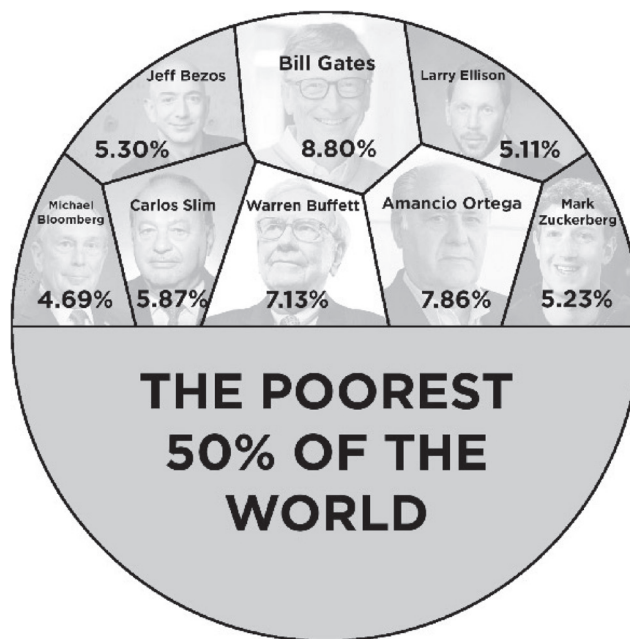
Рисунок 1 — Глобальна нерівність (сформовано за даними звіту Оксфам [2])

Як свідчать дані Всесвітнього економічного форуму (далі — ВЕФ, 2017), сім з десяти осіб живуть в країнах, де економічна нерівність суттєво збільшилась за останні 30