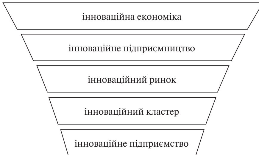
Рисунок 2 — Діалектичний зв'язок елементів інноваційного простору (розроблено автором)

зується на таких моментах: інновації, наукові досягнення, знання) [4, 7], системний (є більш розповсюдженим і базується на розумінні інноваційної економіки як: інноваційних систем, структури, моделі, інституалізації, сфери інформації, сфери знань, технології, соціуму, капіталу) [7, 12, 18], ресурсний (стосується розуміння таких аспектів: творчий людський капітал, інвестиційні ресурси) [5, 11], функціональний (визначає науку, освіту, знання як основні моменти інноваційної економіки) [6, 10].