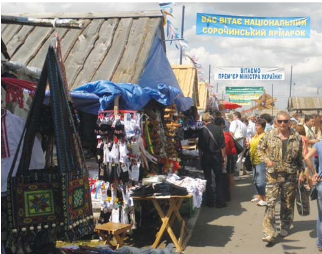
Рис. 1 – Сорочинський ярмарок 2012

Оспіваний нашим великим земляком Миколою Васильовичем Гоголем, Сорочинський ярмарок сьогодні є не лише видатним ярмарково-виставковим і культурним заходом, але й яскравою та привабливою візитною карткою України.