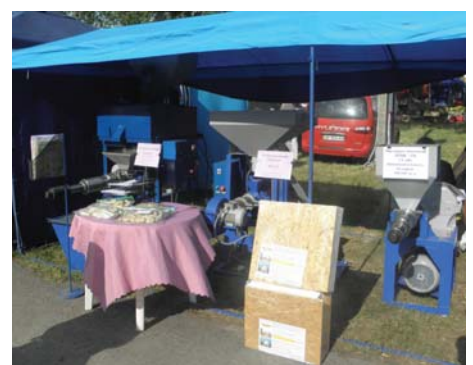
Рис. 12 – Стенд ПП “Лаврін”

ПП “Лаврін” демонструвало на ярмарці екструдери ЕКЗ-130, ЕКЗ-95 і ЕКЗ-170, а також олійні преси ММШ-130 і ММШ-220.