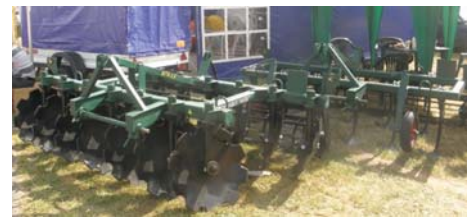
Рис. 5 – Культиватори ТПН-2,4 «Вакула» ВАТ «Галещина, Машзавод»