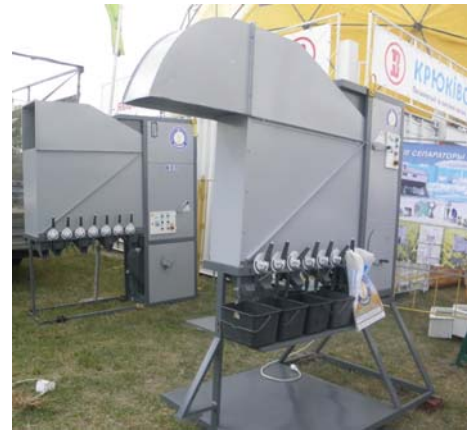
Рис. 4 – Динамічні сепаратори фірми «Агротех»

За допомогою мобільних кормозмішувачів можна приготувати повнораціонні кормосуміші, які сприяють нормованій годівлі, підвищують рівень споживання та зменшують втрати кормів. Головним функціональним елементом такого кормозмішувача є блок управління. Це не просто електронні ваги, що показують результат зважування: зоотехнік отримує можливість програмувати