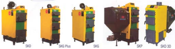
Рис. 3 – Твердопаливні котли Krzaczek (SKD, SKG Plus, SKG, SKP, SKD 3D)

Чи не вперше на Сорочинському ярмарку ПП «Бартошук А. Г.» пропонувало відвідувачам виставки економічні твердопаливні котли Krzaczek потужністю від 10 до 500 кВт, які працюють на дровах, палетах та вугіллі (рис. 3). Основними перевагами названих твердопаливних котлів порівняно з котлами інших виробників є низькі витрати палива, низький рівень шкідливих викидів, високий коефіцієнт корисної дії (до 91%), що обумовлюється в першу чергу застосуванням добротної теплової ізоляції (товщина 5 см).