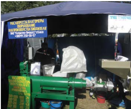
Рис. 10 – Стенд ЗАТ “Укрекспо-Процес” (м. Київ)

ряд твердопаливних побутових водогрійних котлів фірми “Kalvis” (Литва) (кількість моделей 14 шт.) демонстрував на ярмарку офіційний дилер фірми ТОВ “Дніпро-Kalvis” (м. Черкаси).