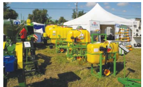
Рис. 2 – Техніка ПП “Бартощук А. Г.”

Що ж цікавого було запропоновано на Сорочинському ярмарку для виробника сільськогосподарської продукції?