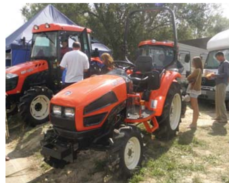
Рис. 8 – Колісні трактори фірми "Kioti" (Корея)