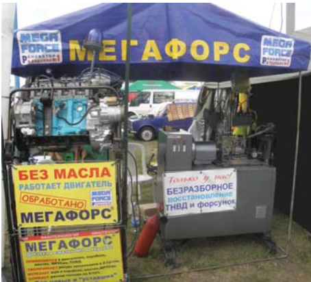
Рис. 13 – Стенд фірми МЕГАФОРС

ресурс двигуна в 2-3 рази та зменшують витрати палива на 10-15%, знімають шум в трансмісії і збільшують ресурс вузла в 2-3 рази (рис. 13).