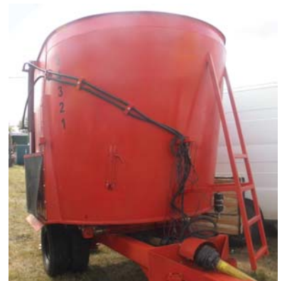
Рис. 6 – Фермський комбайн КЗН-9 «Данило» виробництва ВАТ «Галещина, Машзавод»