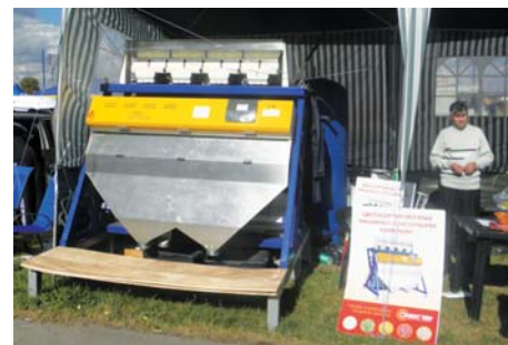
Рис. 7 – Стенд компанії «Орієнт Вей»

питанні переробки сільськогосподарських культур. ТОВ "Орієнт Вей" – єдиний офіційний представник в Україні однієї з найбільших китайських компаній з виробництва кольоро-сортувального обладнання «Hefei Meiya Optoelectronic Technology Inc» (рис. 7), котре в народі має назву "сортекс". З використанням сортексів у лініях переробки зерна, засміченість продукту на виході становить не більше 0,02%, а вміст придатного зерна у відходах – не більше ніж 0,5%. Сортекс може з легкістю виділити гречиху від соняшнику, пшеницю від вівса, недозрілу зелену сою, спориш – від злакових та кукурудзу – від соняшнику та інших смітних включень органічного та неорганічного походження. Завдяки цьому сортекси компанії «Орієнт Вей» можна ефективно використовувати в рослинництві, зернопереробній,