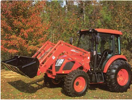
Рис. 9 – Універсальний трактор RX6010PC (потужність 59 к.с.) з навантажувачем фірми “Kioti” (Корея)