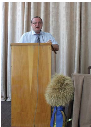
Рис. 3 – Виступ Директора Департаменту землеробства Міністерства аграрної політики та продовольства України Демидова О.А.

За підсумками роботи обласних штабів О.А. Демидов звернув увагу на складну ситуацію пересівів у таких регіонах, як Херсонська, Миколаївська, Харківська та Дніпропетровська області, а також акцентував увагу на забезпеченні посівним матеріалом наступної посівної компанії.