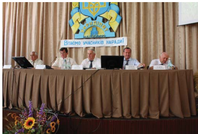
Рис. 4– Президія Засідання штабу та наради з питань організації проведення жнив у 2012 році та підготовки до посіву озимих культур під урожай 2013 року

- залучити необхідну кількість зернозбиральних комбайнів для проведення збирання ранніх зернових та зернобобових культур в оптимальні терміни (не більше 12-15 календарних днів), приділити належну увагу післязбиральній обробці та сушінню зерна;