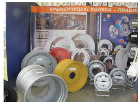
Рис. 8 – Колісні диски Кременчуцького колісного заводу