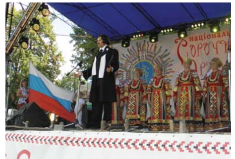
Рис. 3 – Відвідувачів Сорочинської ярмарки вітає театралізований Гоголь

Серед них – обприскувачі, ґрунтообробні агрегати, косарки і граблі, прес-підбирачі, картоплексаджалки і картоплекопалки, розкидачі добрив, елементна база до обприскувачів, карданні вали та інші