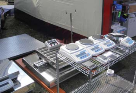
Рис. 17 – Вагові пристрої НВП «Техноваги»

«Radwag» (Польща), лабораторні ваги, промислові ваги і автомобільні тензометричні ваги серії ТВА виробництва НВП «Техноваги».