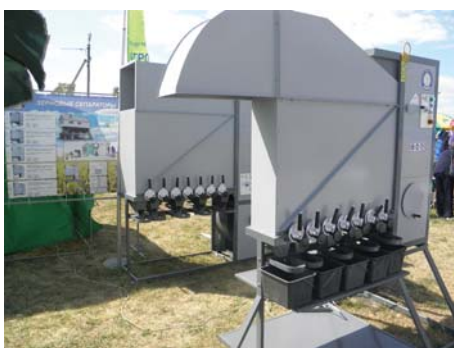
Рис. 9 – Динамічні сепаратори ПП «Виробнича фірма «Агротех»

Обладнання для очищення та калібрування зерна представили ПП «Виробнича фірма «Агротех» (м. Луганськ) (рис. 9),