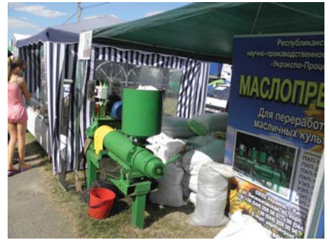
Рис. 10 – Маслопреси ПХП ЗАТ «РНПП «Укреспо-Процес» (м. Київ)

Завод вагодозувального обладнання «Техноваги» (м. Львів) представив на ярмарку спектр різноманітних вагових пристроїв (рис. 12). Серед них пропонувалась відвідувачам виставки електронні лабораторні ваги фірми