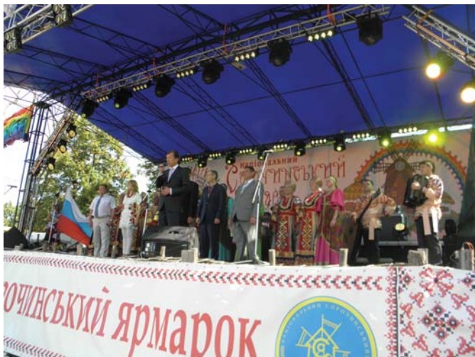
Рис. 1 – Сорочинський ярмарок відкриває віце-прем'єр-міністр України Олександр Вілкул

20-24 серпня в селі Великі Сорочинці відбувся традиційний Сорочинський ярмарок. Відкрив ярмарок віце-прем'єр-міністр України Олександр Вілкул (рис. 1).