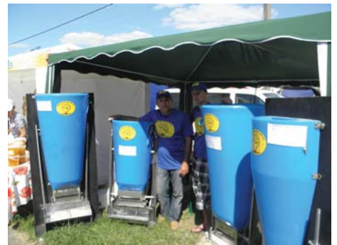
Рис. 11 – Автогодівниці для свиней фірми «DiMAX»

Єдиний завод-виробник! Приватне підприємство “Виробнича фірма “АГРОТЕХ”