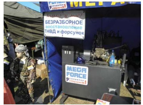
Рис. 6 – Стенд фірми ПП НВФ «Маскарт»

Для забезпечення потреб невеликих фермерських господарств ХТЗ пропонував трактори невеликої потужності для потреб власників дрібних ділянок малогабаритних тракторів ХТЗ-2511 (рис. 9). Трактор характеризується досить високими показниками призначення та добре пристосований до виконання сільськогосподарських робіт в агрегаті з вітчизняними та зарубіжними сільськогосподарськими машинами. Трактор має відносно невеликі габарити і