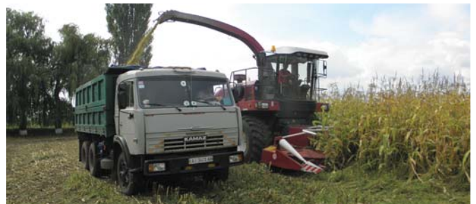
Рис. 1 – Кормозбиральний комбайн КВК-800-36 в роботі

• Оснащений надійними механічними фіксаторами механізму навішування для безпечного проведення технологічного обслуговування і транспортних перевізів з навішеними адаптерами