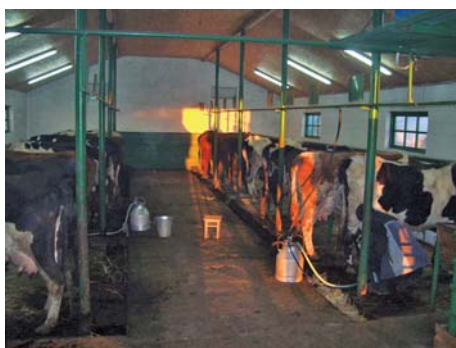
Рис. 9 – Внутрішній вигляд молочної ферми на 20 корів (с. Українка Апостолівського р-ну)

Тваринницька будівля характеризується такими розмірами: ширина – 8,7 м, довжина – 20,4 м, висота – 4,0 м (рис. 8). В процесі будівництва ферми для утримання двадцяти корів були використані такі матеріали: шлакоблоки, труби металеві, профнастил, вікна металопластикові, залізобетон, бетон, пиломатеріали, плита ОСБ. На фермі облаштовані стійла у два ряди для прив'язного утримання