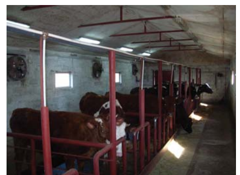
Рис. 5 – Внутрішній вигляд молочної ферми на 10 корів (с. Панасівка Новомосковського р-ну)

Доїння корів проводять індивідуальною установкою фірми «De Laval». Належний мікроклімат в корівнику створюється з використанням системи вентиляції фірми «Secco» (Канада), до складу якої входять клапани вентиляційні (7 шт.) і три вентиляційні установки. Для напування корів використовують індивідуальні чашкові напувалки. Для доставлення кормів на ферму і роздавання їх худобі використовують трактор Т-16 з причіпом і візок ручний. Для видалення гною з приміщення корівника використовують візок ручний.