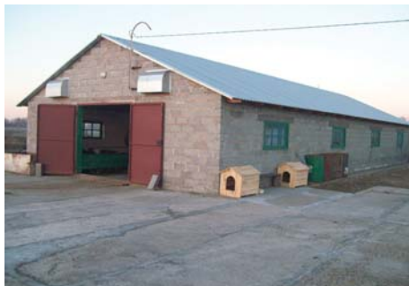
Рис. 8 – Будівля молочної ферми на 20 корів (с. Українка Апостолівського р-ну)