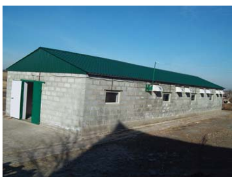
Рис. 4 – Будівля молочної ферми на десять корів (с. Панасівка Новомосковського р-ну)

Приміщення корівника має такі розміри: ширина – 5,3 м, довжина – 22,5 м, висота – 3,5 м (рис. 4). Для будівництва тваринницької будівлі використано такі матеріали: шлакоблоки, труби металеві, профнастил, пиломатеріали, плиту ОСБ, вікна металопластикові, залізобетон, бетон. В приміщенні облаштовані