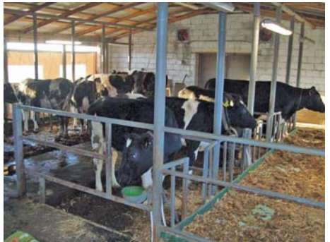
Рис. 7 – Молочна ферма на десять корів (с. Українка Апостолівського р-ну)

Для доїння корів використовують індивідуальну доїльну установку фірми «De Laval». Для підтримання належного мікроклімату стіни тваринницької будівлі облаштовують боковими вентиляційними шторами висотою 1,4 м, а також використовують три вентиляційні установки, розміщені в торцях приміщення. В молочної розміщені танк-охолоджувач молока фірми «Mueller» місткістю 550 л, водонагрівач, умивальник, молочна посуда. Для напування корів використовують чашкові напувалки. Для доставлення кормів на ферму і роздавання їх тваринам використовують мотоблок з причіпом і візок ручний. Для прибирання гною з корівника використовують візок ручний.