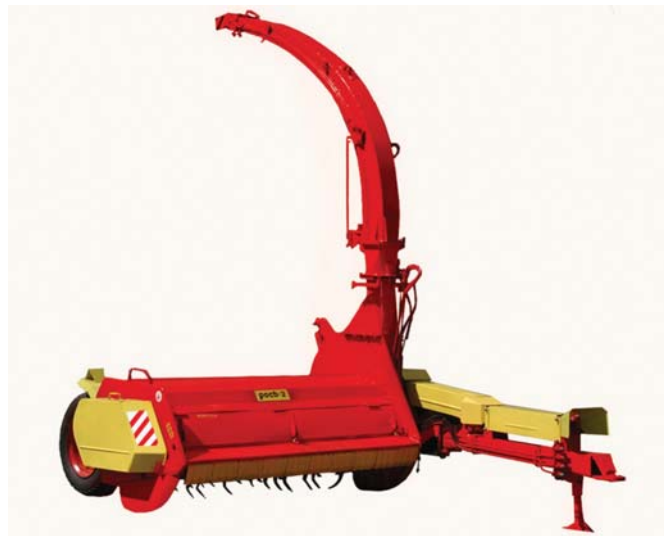
Рис. 2 – Кормозбиральний комбайн «Рось-2» виробництва ТОВ НВП «БІЛОЦЕРКІВМАЗ»

менеджменту, але й, у першу чергу, високого рівня технічної оснащеності підприємства. Технологічні компетенції конструкторських та робітничих кадрів, унікальне обладнання, яке працює на підприємстві, дозволяють виробляти техніку, за допомогою якої можна отримати високий врожай, максимально скоротивши строки проведення польових робіт і робочий час. Виробничо-технологічне обладнання заводу об'єднано в замкнений цикл, починаючи з виробництва заготовок, штампування, механообробки, зварювання, термообробки і закінчуючи складанням і фарбуванням готової продукції.