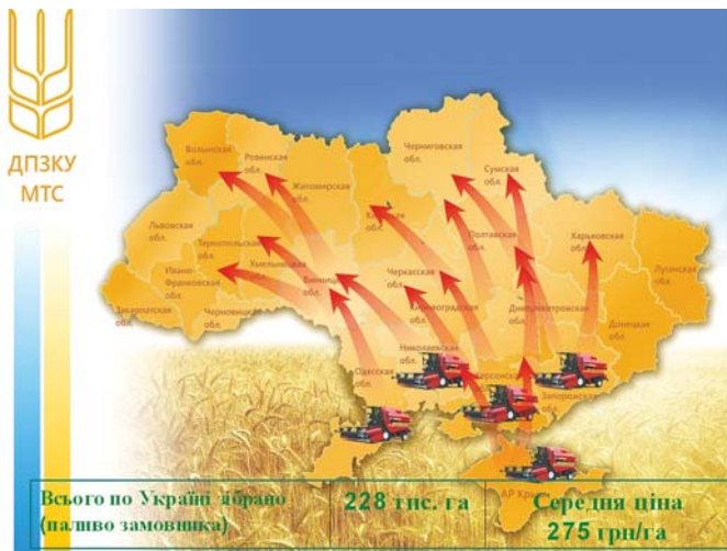
Рис. 8 – Надання послуг у збиранні врожаю ранніх зернових та зернобобових культур ДПЗКУ МТС в 2012 році

Серед запропонованих Мінагрополітики України організаційних заходів є залучення високопродуктивних зернозбиральних комбайнів ДПЗК України.