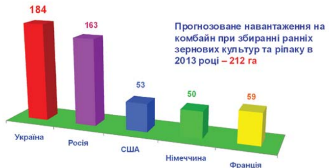
Рис. 5 – Навантаження на один зернозбиральний комбайн в різних країнах світу, га