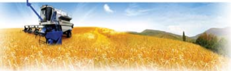
Рис. 7 – Організаційні заходи на період збирання зернових

Навантаження на зернозбиральний комбайн по регіонах України коливається в межах від 78 га у Волинській області до 402 га в АР Крим. Середнє навантаження по Україні на один комбайн становить 212 га (рис. 6).