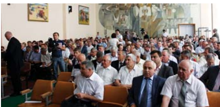
Рис. 2 – Учасники засідання Штабу з питань організації збирання зернових і підготовки до посіву озимих культур

Держсільгоспінспекції, регіональних центрів наукового забезпечення АПВ НААН України, громадські організації, засоби масової інформації (рис. 2).