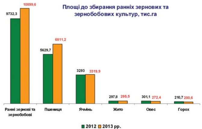
Рис. 4 – Обсяги робіт із збирання зернових та зернобобових культур в Україні в 2013 році

Застарілий існуючий парк зернозбиральних комбайнів та повільне його оновлення призвели до того, що навантаження на один зернозбиральний комбайн в Україні у декілька раз вище, ніж в передових країнах Європи та світу, внаслідок чого тривалість збирання ранніх зернових та зернобобових культур у 2012 році склала 49 днів, замість оптимальних 14. Втрати зерна при цьому склали 32 відсотки (рис. 5).