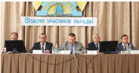
Рис. 1 – Вступне слово заступника Міністра аграрної політики та продовольства України Давиденка В.М.

Із вступним словом до учасників засідання Штабу з питань організації збирання зернових і підготовки до посіву озимих культур звернувся заступник міністра аграрної політики та продовольства України Давиденко В.М. (рис. 1).