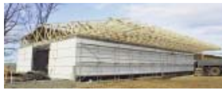
Рис. 4 – Дах з дерева основної за призначенням будівлі у поєднанні з навісом