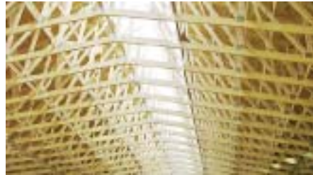
Рис. 3 – Світловий коньок, виготовлений з використанням дерева