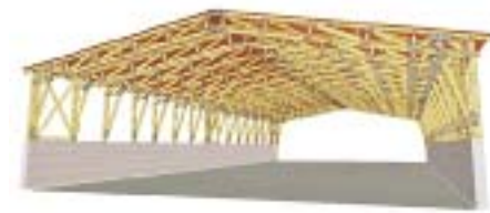
Рис. 6 – Дах з дерева для зберігання техніки