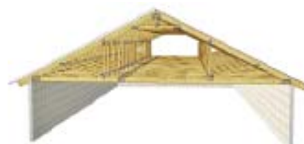
Рис. 8 – Інший варіант даху конюшні

для техніки, дахи приміщень – це лише неповний перелік об'єктів інфраструктури сільськогосподарських підприємств. Пропонуються різні варіанти облаштування сільськогосподарських об'єктів, де використовують конструкції з дерева під час їх будівництва чи реконструкції. Розглянемо окремі з них. Дерев'яні конструкції типу «ножиці» використовують у випадку, коли потрібно наростити висоту будівлі (рис. 2). Такий варіант актуальний у разі впровадження інноваційних технологій у тваринництві та будівництва сучасних легкозбірних корівників.