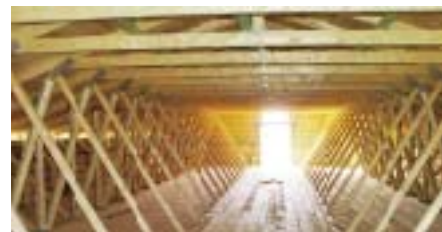
Рис. 7 – Варіант даху конюшні