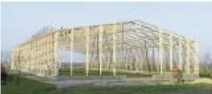
Рис. 1 – Каркас будівлі з дерев'яних конструкцій

Основна частина. Практика виробництва та використання сучасних будівельних конструкцій з дерева свідчить про досить високу їх ефективність. Застосування готових дерев'яних конструкцій (рис. 1)