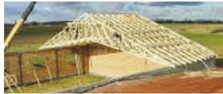
Рис. 2 – Дерев'яні конструкції типу «ножиці»

Далі зупинимось на переліку сільськогосподарських об'єктів, де пропонується використання дерев'яних конструкцій. Корівники, свинарники, вівцеферми, конюшні, звіроферми, птахофабрики, вигульні майданчики для тварин, манежі, зерносховища, навіси