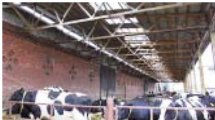
Рис. 9 – Облаштування вигульних майданчиків для моціону тварин

(рис. 7, 8). Окремо слід звернути увагу на розробки, пов'язані з облаштуванням вигульних майданчиків для моціону тварин з використанням конструкцій з дерева (рис. 9), манежів для коней (рис. 10) тощо. Можна констатувати, що використання рамних дерев'яних конструкцій є досить високоефективним і дешевим способом будівництва сільськогосподарських об'єктів.