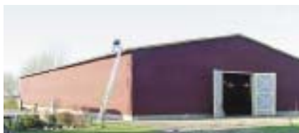
Рис. 10 – Облаштування манежів для коней

Висновки. Аналітичний огляд будівельних конструкцій з дерева у форматі їх використання для