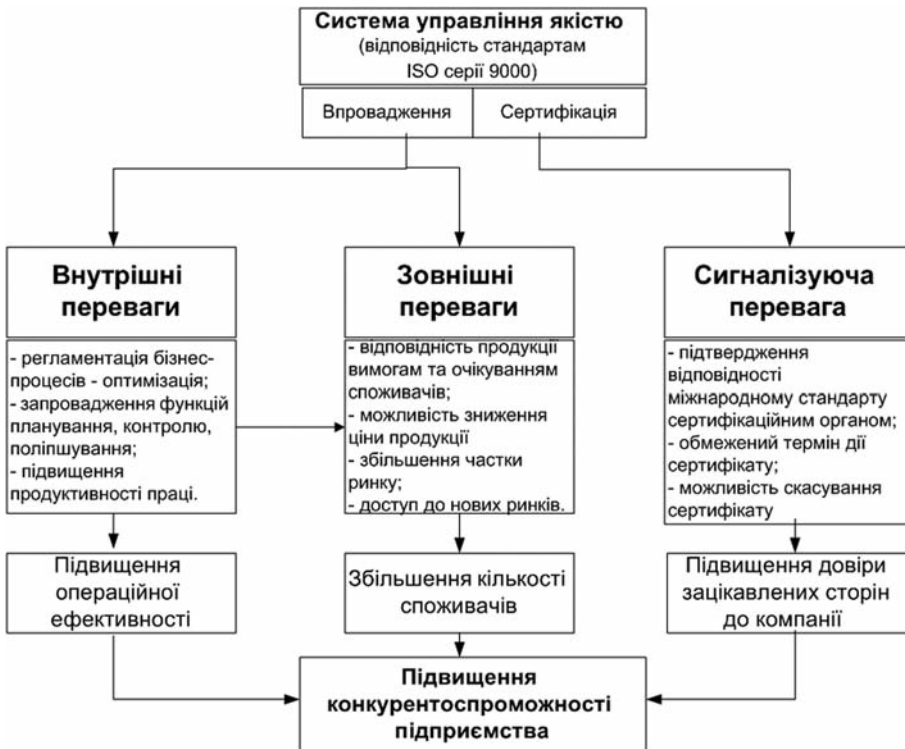
Рис. 2 – Залежність конкурентоспроможності підприємства від системи управління якістю

За рахунок розроблення та впровадження СУЯ підприємство отримує внутрішні і зовнішні переваги. Так, підвищення операційної ефективності досягається за рахунок регламентації бізнес-процесів компанії, в результаті чого забезпечується прозорість виконання процедур та прийняття рішень на всіх управлінських