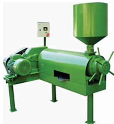
Рис. 5 – Олійний прес типу ПрАТ РНВП «Укрэкспо-Процес» (м. Київ)

Олійні преси для холодного пресування типу ПХП продуктивністю від 80 до 1000 кг/год демонструвало