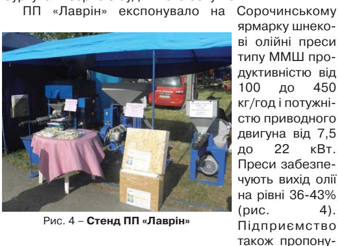
Рис. 4 – Стенд ПП «Лаврін»

буртувати зерно з будь-якого боку машини.