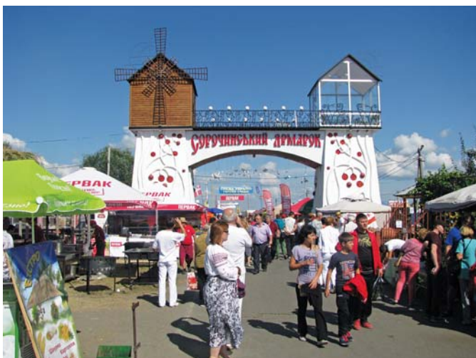
Рис. 1 – Сорочинський ярмарок 2015 року

надійшло понад тисячу заявок від підприємств, приватних підприємців, майстрів народних промислів, закладів громадського харчування та розваг. Серед підприємств близько двох третин брали участь у ярмарку вперше. З усієї України привезли ковбаси і рибу, кондитерські і молочні вироби, крупи і консерви, каву і чай та безліч інших смаколиків. На ярмарку одягали та взували і збирали дітей до школи.