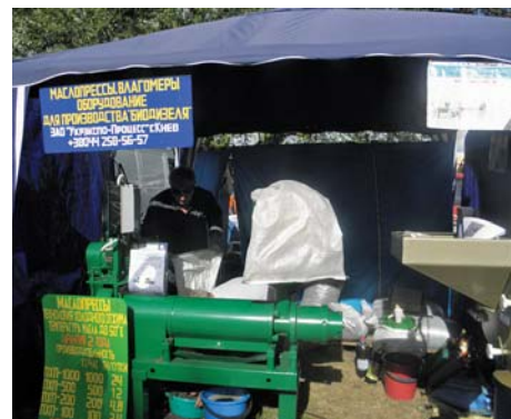
Рис. 6 – Стенд ПрАТ РНВП «Укрэкспо-Процес»

Виробляє ПрАТ РНВП «Укрэкспо-Процес» також преси для гарячого пресування олійних культур УЕП-150, типорозмірний ряд яких включає чотири моделі. Їх продуктивність складає від 100 до 450 кг/год, споживана потужність від 18 до 33 кВт. Пропонувало відвідувачам ярмарки ПрАТ РНВП «Укрэкспо-Процес» також мікронізатори МС-1 для термічної обробки насіння сої та інших зернових матеріалів в інфрачервоному опроміненні, а також для прожарювання