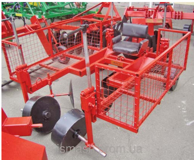
Рис. 7 – Машина для посадки саджанців

Різноманітну техніку для лісового господарства в широкому асортименті пропонувало ПАТ «Спецлісмаш» (м. Лубни Полтавської області). У першу чергу це ґрунтообробна техніка, в тому числі лісові плуги ПЛ 75-15М, навісні ґрунтові культиватори КН Гр2,5, лісові дискові культиватори КЛД-1,2, навісні розпушувачі РН-60м. Живу зацікавленість відвідувачів ярмарку викликала викопувальна скоба зі струшувачем СВС-1, машина для посадки саджанців (рис. 7) та інша техніка.