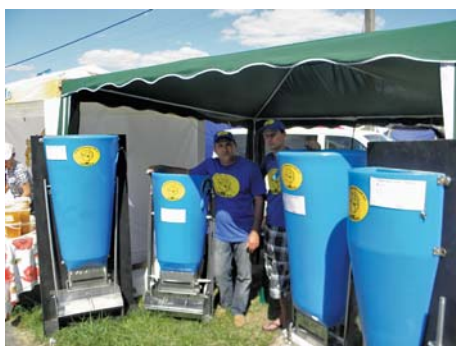
Рис. 8 – Автогодівниці для свиней фірми «DIMAX»

ніпельні напувалки, годівниці з нержавіючої сталі та регулятори кількості корму, який подається. Представлені автомати зручні в експлуатації і можуть ефективно використовуватись на свинофермах різних розмірів.