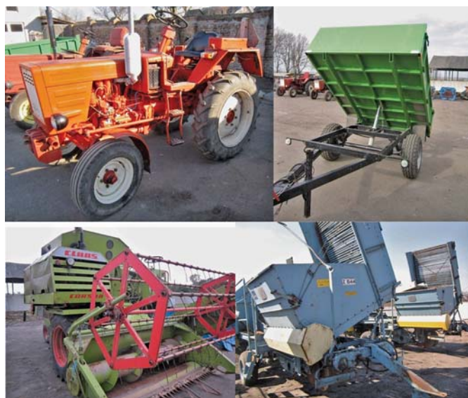
Рис. 2 – Техніка від ПП «Бурчик»

ПП «Бурчик» пропонувало селянам одновісні тракторні причепи вантажопідйомністю 2500кг; обертові