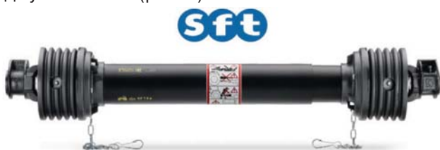
Рис. 1 – Широко-кутове шарнірне з'єднання CONSTANT VELOCITY JOINT серії карданних передач SFT

Виробляє фірма «Бондіолі і Павезі» також ширококутові шарнірні з'єднання CONSTANT VELOCITY JOINT під кутом 50° і 80° (рис. 1).