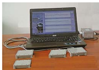
Рис. 1 – Вимірювально-реєстраційний комплекс для контролю динаміки мобільних сільськогосподарських агрегатів. Розробники: д-р техн. наук Артьомов М.П., д-р техн. наук, проф. Лебедев А.Т., д-р техн. наук, проф. Подригало М.А., д-р техн. наук, Клец Д.М.

Вже у 1933 році ХІМЕСГу було передано будинок №45 (колишня Харківська міська жіноча гімназія) по Старо-Московській вулиці (зараз проспект Московський, 45). Це, зокрема, дало змогу відразу розпочати організацію навчальних та наукових лабораторій при кафедрах інституту. У грудні 1933 року інституту було також передано Харківські машинно-