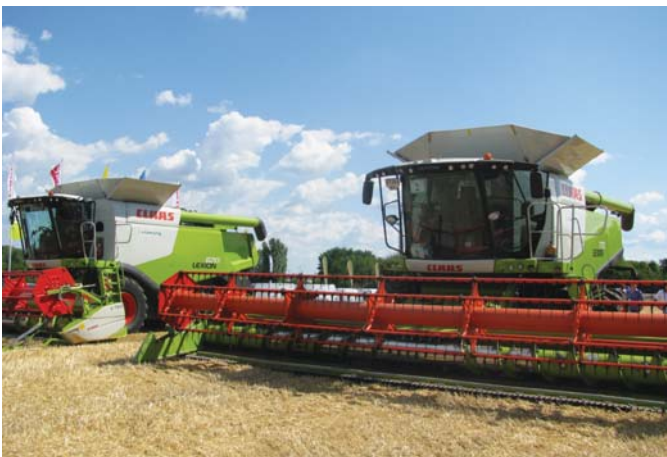
Рис. 2 – Зернозбиральні комбайни Lexion фірми CLAAS

Для великих аграрних фірм компанія Конкорд пропонувала зернозбиральні комбайни Lexion, які обладнані поєднаною системою обмолоту та сепарації «APS+ROTO PLUS» (рис. 2).