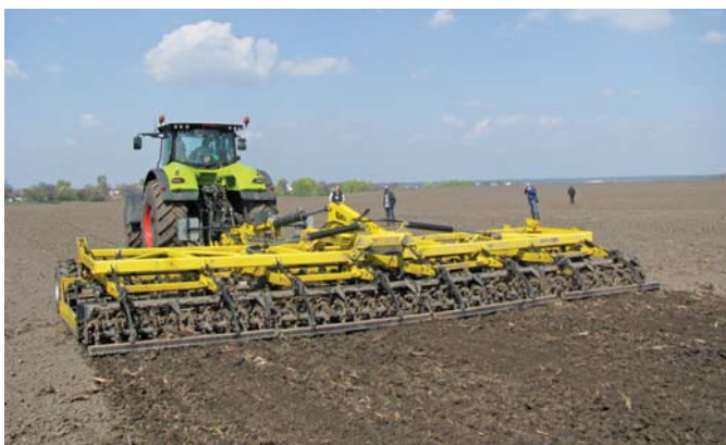
Рис. 7 – Передпосівний компактор SE 800 фірми Bednar (Чехія) в роботі

У попередній підготовці ґрунту для сівби був показаний передпосівний компактор Swifter SE 800, який виготовляється фірмою Bednar (Чехія) (рис. 7).