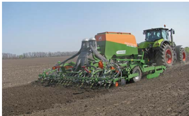
Рис. 4 – Сівалка Cirrus в роботі

Компанія Конкорд демонструвала обробно-посівний агрегат Cirrus 6003-2С з шириною захвату 6 м (рис. 4).