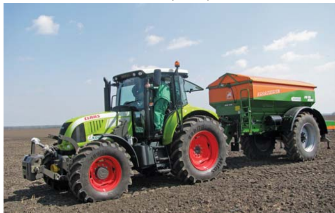
Рис. 5 – Розкидач мінеральних добрив фірми Amazone ZG-TS 8200 на старті

Розкидальні диски обладнані оригінальними розкидальними лопатками. Розкидачі добрив ZG-TS на вимогу замовника постачаються з комплектами розкидних лопаток TS-1 – ширина розкидання 15-24 м;