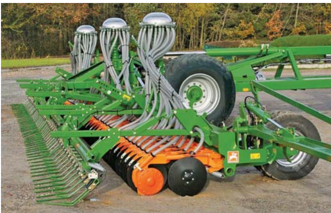
Рис. 3 – Посівний комплекс Citan 1201-С

Зокрема, демонструвалась сівалка Citan 12001-С з шириною захвату 12 м., яка працює зі швидкістю до 20 км/год (рис. 3).