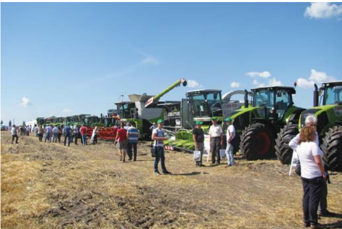
Рис. 1 – Техніка фірми CLAAS на міжнародному Дні поля компанії «Конкорд»

Вступ. 4 серпня 2016 року компанія «Конкорд» провела в с. Митниця Васильківського району Київської області міжнародний День поля. На ньому компанія демонструвала техніку на стаціонарі і в роботі провідних західноєвропейських фірм CLAAS, Amazone, Lemken, Fliegl (Німеччина), Agrifac (Нідерланди) і Bednar (Чехія) (рис. 1).