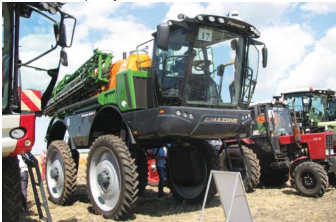
Рис. 6 – Самохідний обприскувач Pantera 4502 фірми Amazone

За рахунок багатофункціонального джойстика AmaPilot і терміналу Amadrive обприскувач Pantera дуже зручний і простий в управлінні. Працює Pantera зі швидкістю до 20 км/год, а на дорогах загального призначення розвиває швидкість до 50 км/год. Тандемне шасі забезпечує не тільки спокійне горизонтальне положення штанги під час наїзду на нерівності, але одночасно гарантує стабільність на схилах.