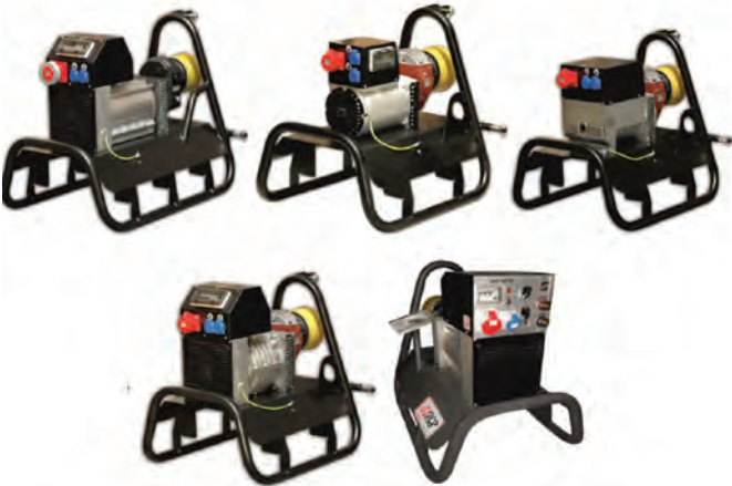
Рис. 1 – Електрогенератори НВП «Агроресурси»

туються лише деталями від кращих виробників з дотриманням найвищих стандартів якості. Генератори Агровольт створені фірмою FOGO спеціально для використання в сільському господарстві. Вони сумісні з будь-якими видами тракторів.