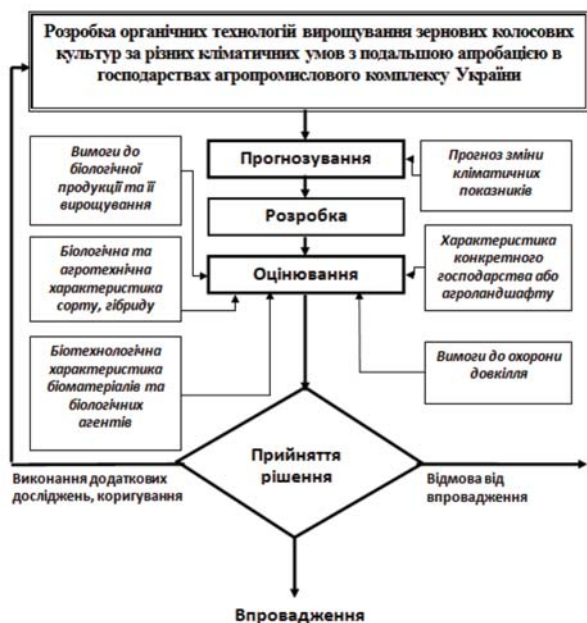
Рис. 2 – Алгоритм розроблення органічних технологій вирощування зернових колосових культур за різних кліматичних умов з подальшою апробацією в господарствах агропромислового комплексу України