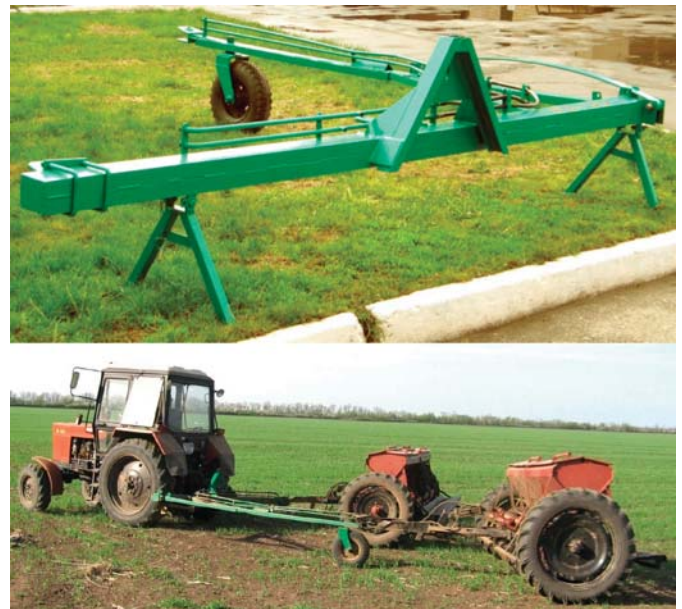
Рис. 3 – Напівнавісна зчіпка СН-7,2 і двомашинний посівний агрегат на її основі

Для агрегування двох причіпних сівалок типу СЗ-3,6 у Таврійському ДАТУ розроблено напівнавісну зчіпку СН-7,2 [19, 20]. Під час її експлуатаційно-технологічних випробувань новим машинно-тракторним агрегатом здійснювали підживлення сходів озимої пшениці аміачною селітрою (рис. 3).