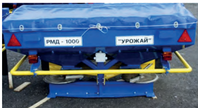
Рис. 6 – Розкидач мінеральних добрив РМД 1000 «Урожай»

ТОВ «Велес Агро» представив сівалку зернову механічну NIKA SZM 4 та плуг оборотний PON 3-35, які викликали інтерес у відвідувачів, зокрема фермерів.