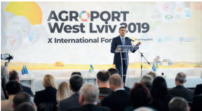
Рис. 1 – Офіційне відкриття форуму «АГРОПОРТ ЗАХІД ЛЬВІВ 2019» Прем'єр міністром України В. Б. Гройсманом

У роботі форуму взяли участь Прем'єр міністр України В. Гройсман (рис. 1), в.о. Міністра аграрної політики та продовольства України О. Трофімцева, Голова Львівської ОДА Синютка та інші високопоставлені гості з Голландії, Польщі, Узбекистану, Казахстану.