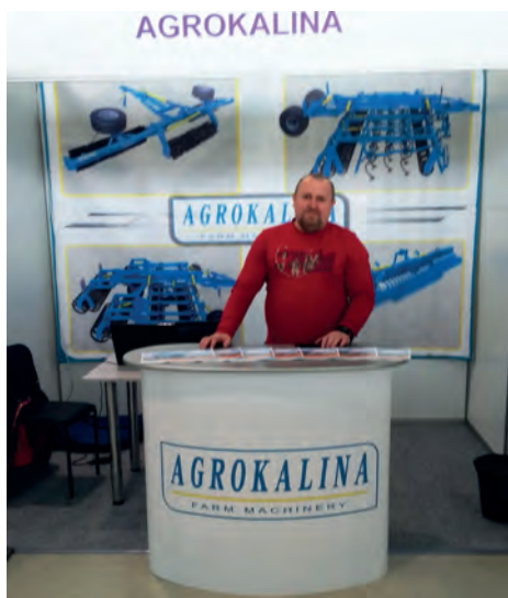
Рис. 5 – Експозиція ТОВ «Агромаш-Калина»