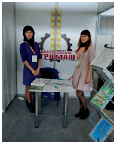
Рис. 4 – Експозиція ТОВ «Краснянське СП Агромаш»

На стенді підприємства ПАТ «Уманьферммаш» можна було ознайомитись з новими конструкціями технічних засобів для аграрного виробництва, а саме луцильником ЛДВ-2,4М, бороною ротаційною БРР-6, культиватором паровим КПС-4М, котком подрібнювачем рослин КЗК-2, зчіпкою гідравлічною СГП-15, плугом оборотним навісним ПОН-6.