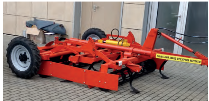
Рис. 3 – Агрегат комбінований для передпосівного обробітку ґрунту ЛК-2 виробництва ТДВ «Львівський завод фрезерних верстатів»

Ґрунтообробна техніка ТОВ «Краснянське СП Агромаш» представлена важкими і легкими дисковими боронами різної ширини захвату, луцильниками, комбінованими агрегатами, глибокородзпущувачами, дискаторами та зчіпками гідрофікованими.