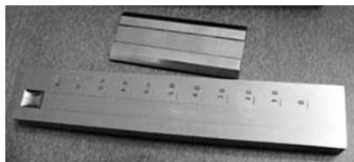
Рис. 4. Прилад «Клин»