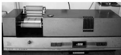
Рис. 3. Прилад Так-оскоп

Для визначення ступеня перетиру використовують на підприємстві традиційний для цього показника прилад «Клин»