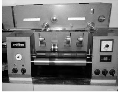
Рис. 5. Прободрукарський пристрій Пруфбау 812

Ретельна підготовка експериментальних зразків, відбір проб з промислових партій фарб, акуратність проведення випробувань і статистична обробка результатів є запорукою надійності і стабільності фарб під час їх застосування за призначенням. Не можна сказати, що вітчизняним виробникам друкарських фарб сьогодні легко конкурувати із зарубіжними. Високі ціни