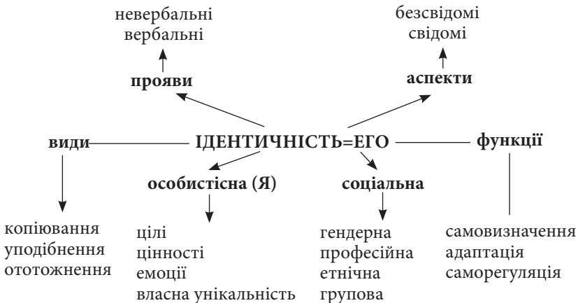
Схема 2. Основні структурні елементи поняття ідентичності

Отже, оглядове вивчення та узагальнення зарубіжних і вітчизняних джерел дає змогу розглядати ідентичність як особистісне утворення, що є компонентом структури самосвідомості та виражається в переживаннях людини. Основні структурні компоненти, види, функції, прояви та аспекти цього феномену нам вдалося зобразити схематично (схема 2).