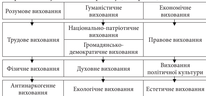
Рис. 1. Ключові напрями змісту виховного процесу у ВНЗ

Виходячи із зазначеного, на сучасному етапі розвитку українського суспільства доцільно виокремити такі ключові напрями змісту виховного процесу (див. рис. 1)