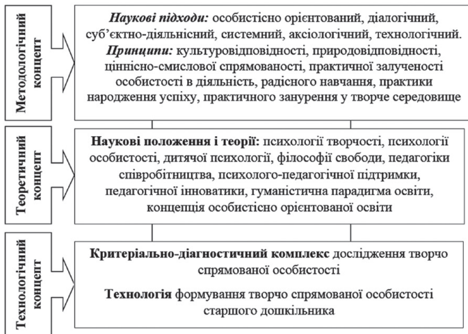
Рис. 2. Теоретико-методологічні засади дослідження процесу формування творчо спрямованої особистості старшого дошкільника у позашкільному навчальному закладі

Як бачимо з рисунка, теоретико-методологічні засади процесу формування творчої спрямованості особистості утворюють єдність трьох концептів: методологічного, теоретичного, технологічного. Проаналізуємо їх детальніше.