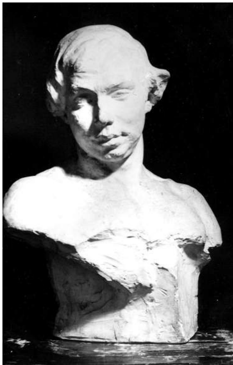
Рис.8 Чоловічий торс

У ранній період творчості (1905–1912) використовувала прийоми імпресіонізму, символізму та сецесії. Синхронізувала пластичні і живописні враження, лаконічно й м'яко моделювала динамічні форми, застосовувала особливі фактурні ефекти та поліхромію – рожеві, жовті, зелені, чорні тони [15].