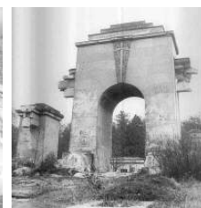
Рис. 8. Руїнування: а – поховання УСС (фото 1971 р.); б – «Цвинтаря орлят»