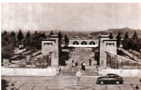
Рис. 6. Пагорб Слави