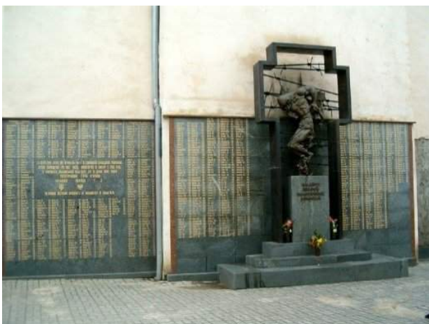
Рис. 12. Пам'ятник жертвам політичних репресій 1939–1941 рр.