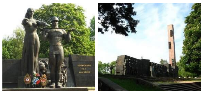
Рис. 7. Монумент бойової слави Радянських Збройних сил