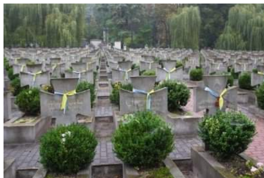
Рис. 10. Український військовий меморіал на Янівському цвинтарі

на нову ділянку Австрійського військового цвинтаря, де також встановили кам'яні хрести за взірцем козацьких, виконані за проектом П. Холодного та Л. Лепкого [18:19].