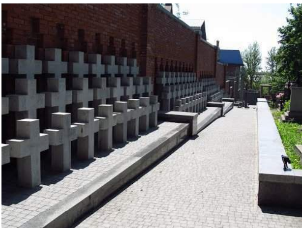
Рис. 11. Меморіальний комплекс, присвячений дітям, замордованим НКВС у тюрмах міста у 1950–1951 рр.