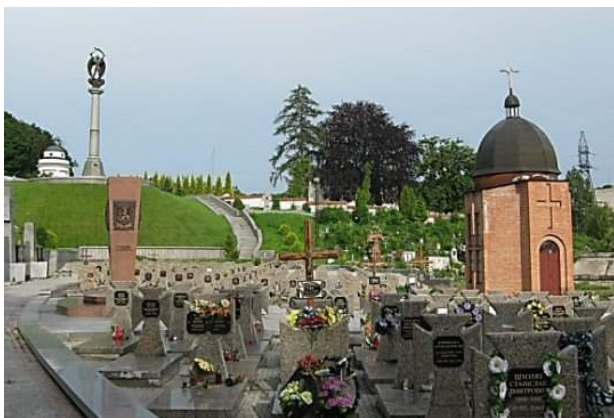
Рис. 9. Меморіал визвольних змагань українського народу