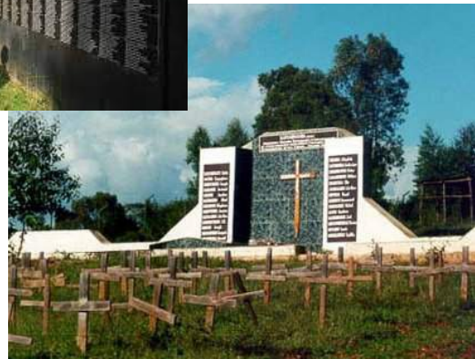
Рис. 2. Меморіал жертвам геноциду в Руанді [2]