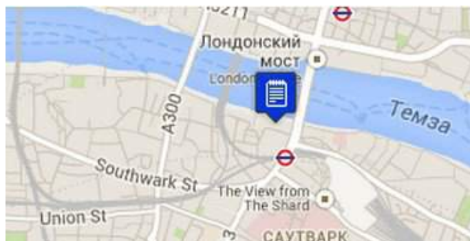
Рис. 3. Меморіал геноциду в Руанді в Лондоні, 2010 р. [17]