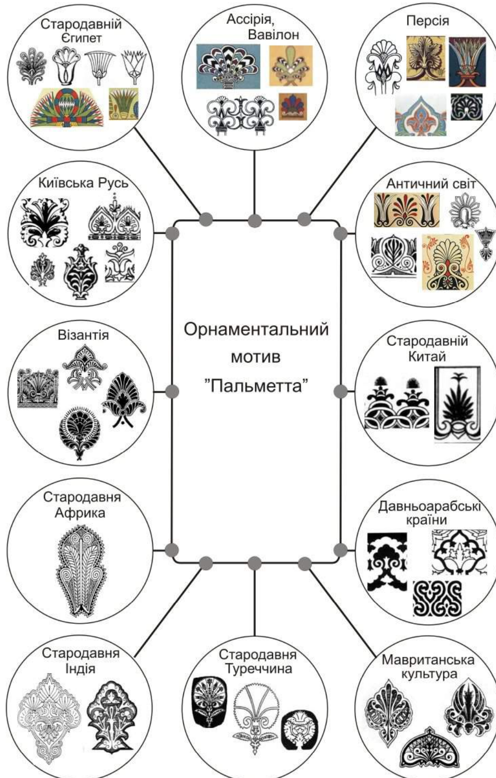
Рис. 1 Модифікація орнаментального мотиву «Пальметта»

У Середній Наддніпрянщині здавна поширені настінні розписи, що вражають різноманітністю сюжетів, різьблення по дереву, яке використовується для оздоблення вікон, дверей, фронтонів, ганків [6: 62]. Серед сюжетів розписів переважали зображення птахів та квітів, сонця, композицій з геометричних елементів: кругів та ромбів, стрічкові орнаменти.