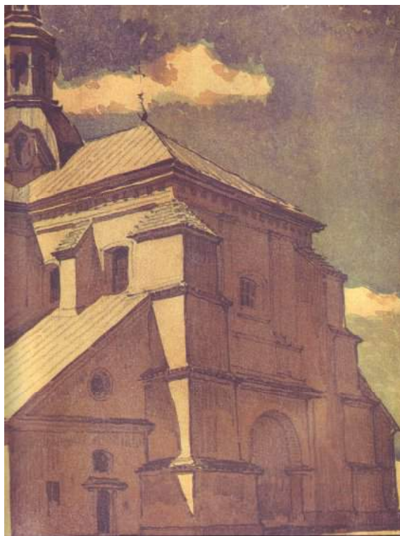
Іл. 2. Дмитро Яблонський. Колегіата. 1949. Картон, акв.; 22х21,5