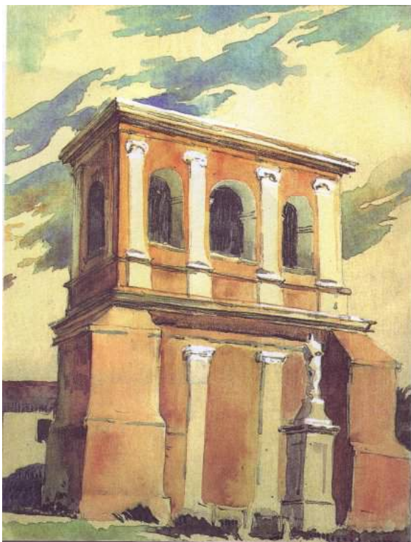
Іл. 1. Дмитро Яблонський. Дзвіниця Колегіати. 1949. Картон, акв.; 22х21,5