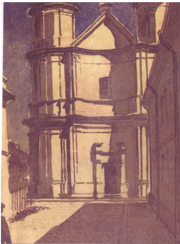
Іл. 3. Дмитро Яблонський. Вірменський костьол у Станіславові. 1949. Картон, акв.; 22х20,5