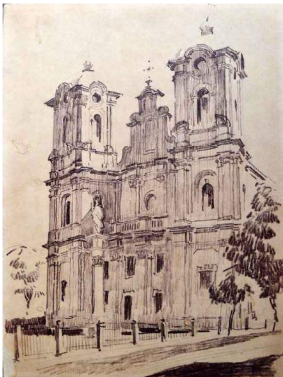
Іл. 5. Дмитро Яблонський. Городенка. Фасад костьолу Непорочного Зачаття Діви Марії. Картон, сепія; 250x335