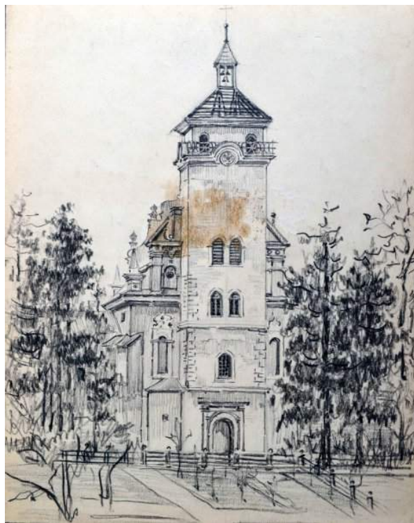
Іл. 6. Дмитро Яблонський. Рогатин. Костьол Св. Йосипа XVIII ст. Картон, сепія; 263x332