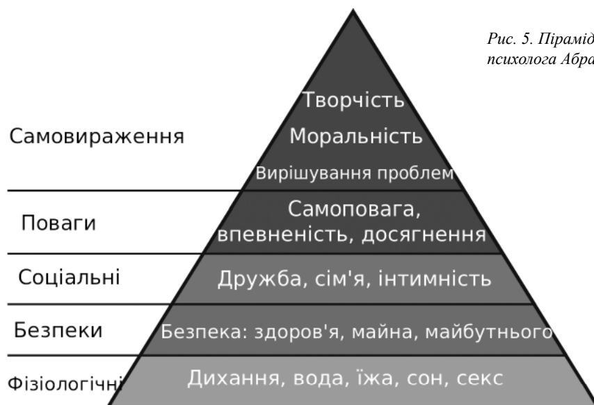
Рис. 5. Піраміда потреб психолога Абрахама Маслоу

ектною групою Unika Architecture & Urbanism в 2013 році. Їх проект передбачає створення зеленої зони та ряду громадських просторів над існуючим ринком. Ідея заслуговує поваги, але загалом проектне рішення дискредитує надто сучасна пластична мова архітектурного об'єму. Інновації — це, безперечно, добре, але саме середовищний підхід, на думку автора, повинен становити основу будь-якого проектного рішення.