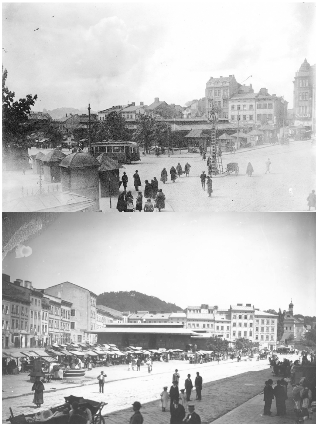
Рис 4. Історичні фото площі Торгової (м. Львів)

Спробу критично осмислити значення визначеної площі в місті було зроблено лише про-