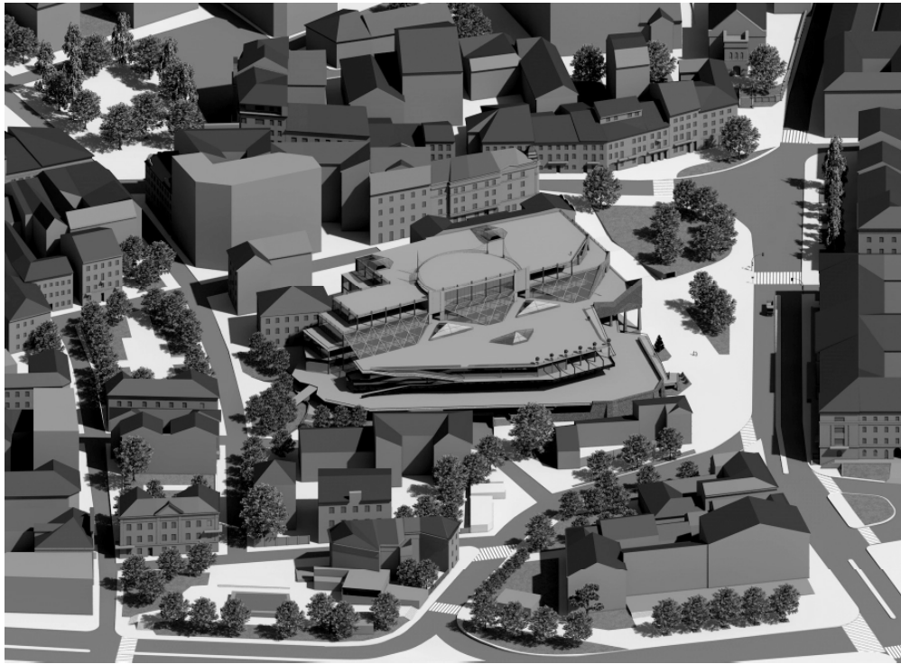
Рис. 6. Аксонометрія проєктованого комплексу