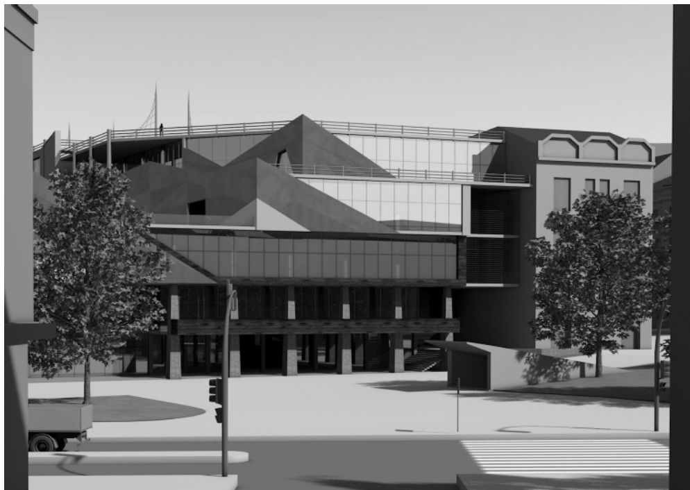
Рис. 7. Фасад з вул. Театральної

часовими вимірами та дає змогу сезонно пере- брендівувати комплекс екологічними й ландшафт- ними засобами (рис. 6–8).