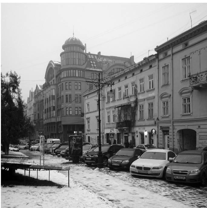
Рис. 2. Будинок на розі вул. Валової та вул. Сербської. Приклад використання «псевдоісторизму» в історичному середовищі. Архітектор — Базюк Олександр (2002)