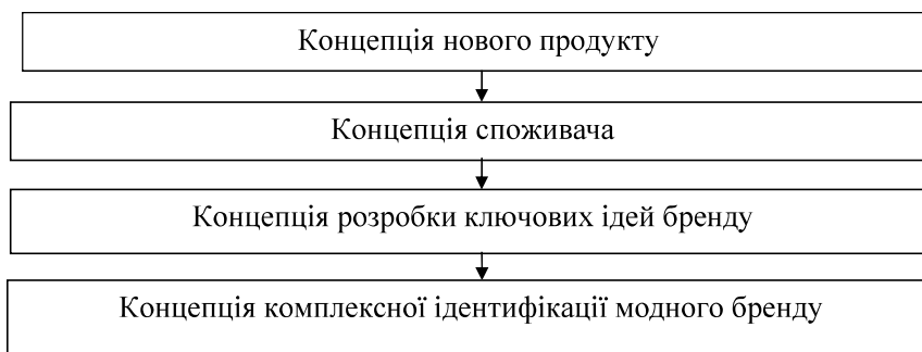
Рис. 1. Етапи створення бренду

обіцянку споживачам від розробників бренду. У кожен конкретний момент будь-який бренд має певний імідж — унікальний набір асоціацій, які зараз знаходяться в думках споживачів. Ці асоціації виражають те, що означає бренд саме зараз на даний період часу і в даних соціальних умовах. Зокрема, імідж бренду може сформувати рекламна кампанія.