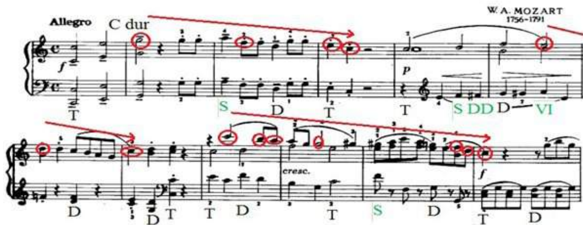
Рис. 1. Отрывок сонатины Моцарта До мажор