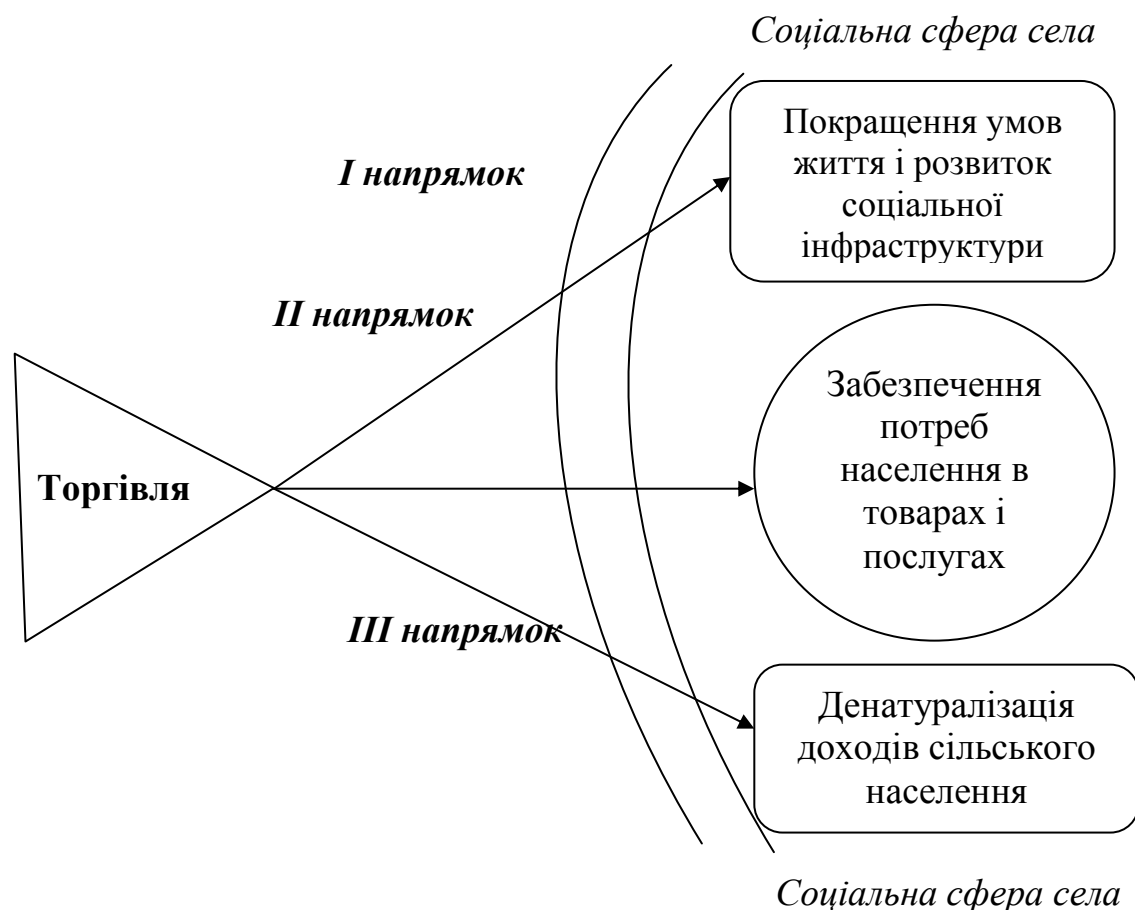
Рис.1. Стратегічні напрямки впливу торгівлі на соціальні аспекти розвитку села

Перший напрямок – покращення умов життя і розвиток соціальної інфраструктури є найбільш актуальним, оскільки саме тут перехрещуються складні проблеми життєвого середовища, соціального обслуговування і соціального захисту сільського населення, у вирішенні яких активну роль повинна відігравати торгівля.