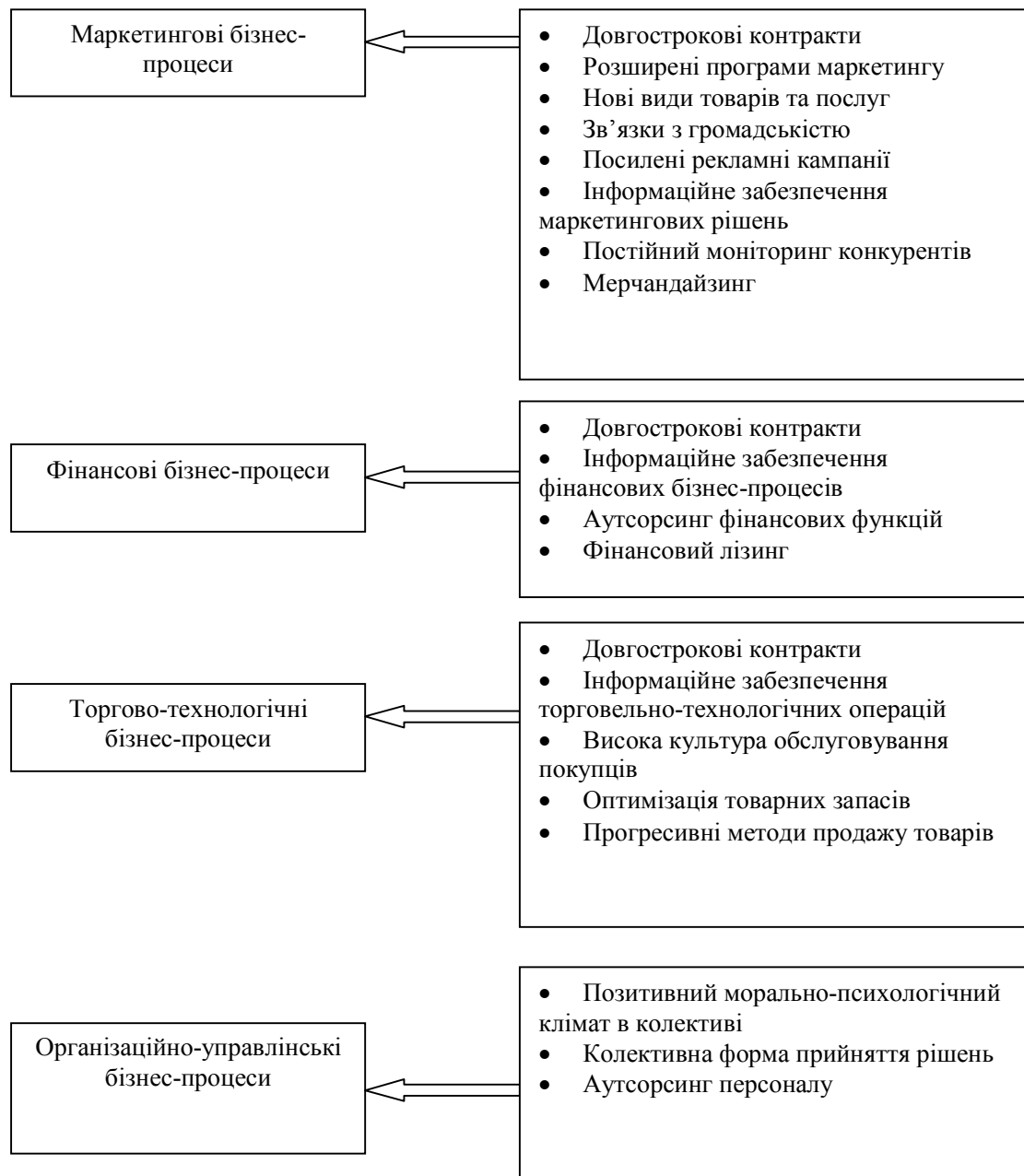
Рис. 1. Джерела виникнення синергії бізнес-процесів торговельного підприємства

- прозорість, роз'яснення працівникам полі-