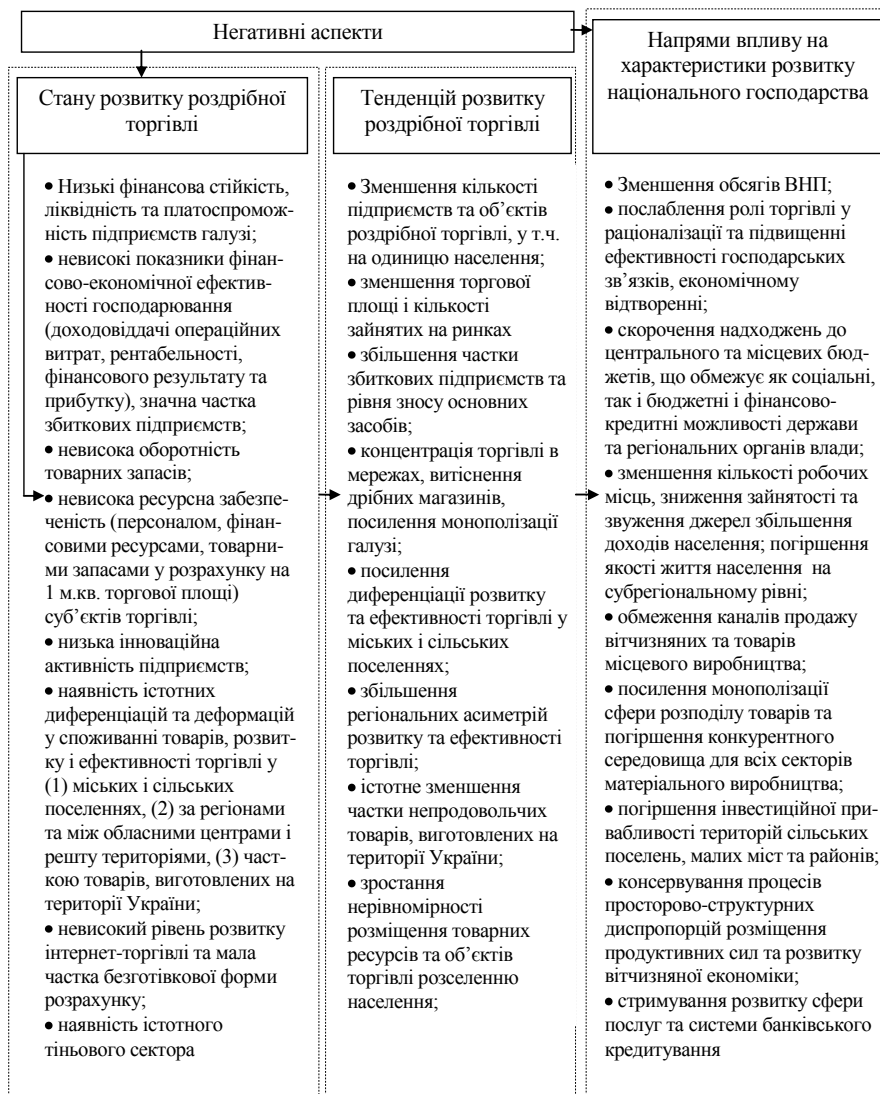
Рис. 3. Негативні наслідки недостатньо ефективного регулювання внутрішнього ринку в Україні

(структурних підрозділів) з розвитку інноваційної діяльності; покращенням структури кадрів та збільшенням частки керівників і фахівців з вищою освітою та з досвідом науково-дослідної роботи; ініціюванням створення кластерів за участю підприємств торгівлі, науково-дослідних установ, фінансово-кредитних організацій, інституцій інноваційної інфраструктури; удосконаленням асортиментної структури у напрямі розширення частки інноваційних товарів, а також над посиленням співпраці з виробниками та дистрибуторами інноваційної продукції.