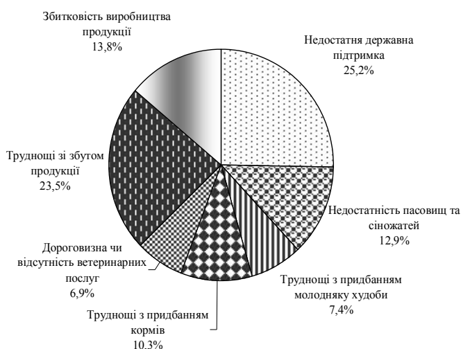
Рис. 1. Основні чинники, що стримують розвиток тваринництва в домогосподарствах Львівщини (за результатами опитування власників)

Виробництво продукції тваринництва в господарствах населення розміщується дуже нерівно за регіонами держави, і йому притаманні різні темпи розвитку. Лише в Миколаївській та Закарпатській областях помітний приріст виробництва продукції тваринництва господарствами населення. У решті областей допущено спад виробництва. При цьому