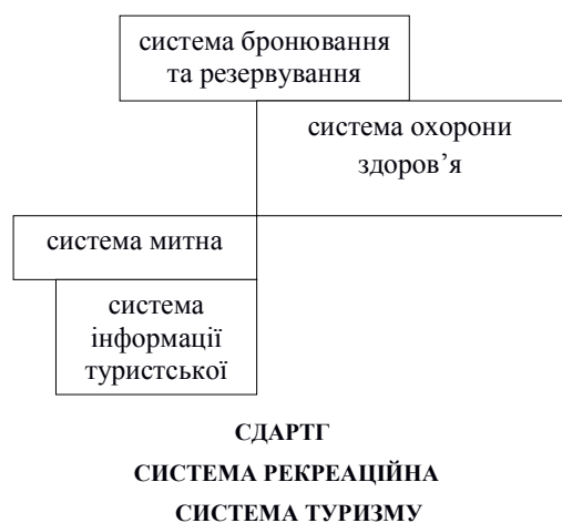
Рис. 1. Місце СДАРТГ у загальній системі розвитку туризму

При цьому, як у системах, до яких може належати СДАРТГ, так і тих, які можуть входити до неї, не враховано необхідність управління та регулювання таких сфер, як культурна й екологічна (природна). Отже, формування СДАРТГ – як складової загальних систем туризму та рекреаційної – з одного боку, й такої, що вміщує в собі інші розглянуті (табл. 1), дозволить усунути протиріччя порушення системного взаємозв'язку між сферами галузі – з наукової точки зору, а з практичної – на цих основах створити базис для виведення галузі з кризи з метою забезпечення її подальшого розвитку. З цієї точки зору, місце СДАРТГ у загальній системі розвитку туризму можна виразити через взаємозв'язок між сферами галузі та іншими системами (рис. 1).