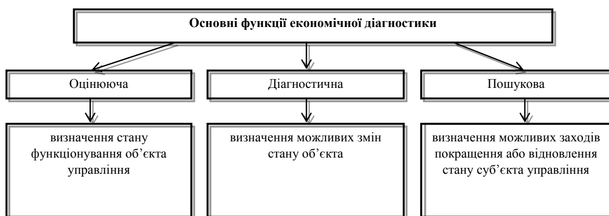
Рис. 2. Характеристика функцій економічної діагностики

Діагностика фінансового стану є обов'язковою складовою фінансового менеджменту будь-якого підприємства та передбачає здійснення повномасштабного аналізу за результатами його господарської діяльності, яка, в свою чергу вважається ефективною, якщо підприємство раціонально використовує реальні ресурси, своєчасно погашає зобов'язання, функціонує рентабельно [2, с. 190]. Вдтак, можна дійти висновку, що економічна діагностика дозволяє: