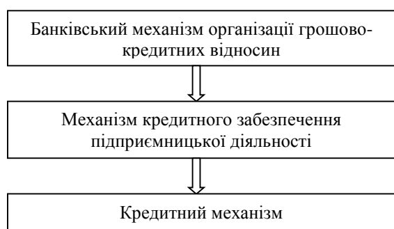
Рис. 1. Механізм кредитного забезпечення підприємницької діяльності в ієрархічній підпорядкованості до організаційних форм кредитних відносин

У той же час між вказаними дефініціями прослідковується з нашої точки зору певна ієрархічна послідовність, оскільки спільною рисою є реалізація банками на практиці функції посередництва в кредиті. Загалом вказану підпорядкованість організаційних форм кредитних відносин можна зобразити наступним чином (рис. 1). Отже, виокремлений нами механізм кредитного забезпечення підприємницької діяльності є органічною складовою банківського механізму організації грошово-кредитних відносин, а кредитний механізм, відповідно, охоплює лише мікроекономічний аспект організації вказаного механізму, оскільки відображає лише технологічний інструментарій його реалізації.