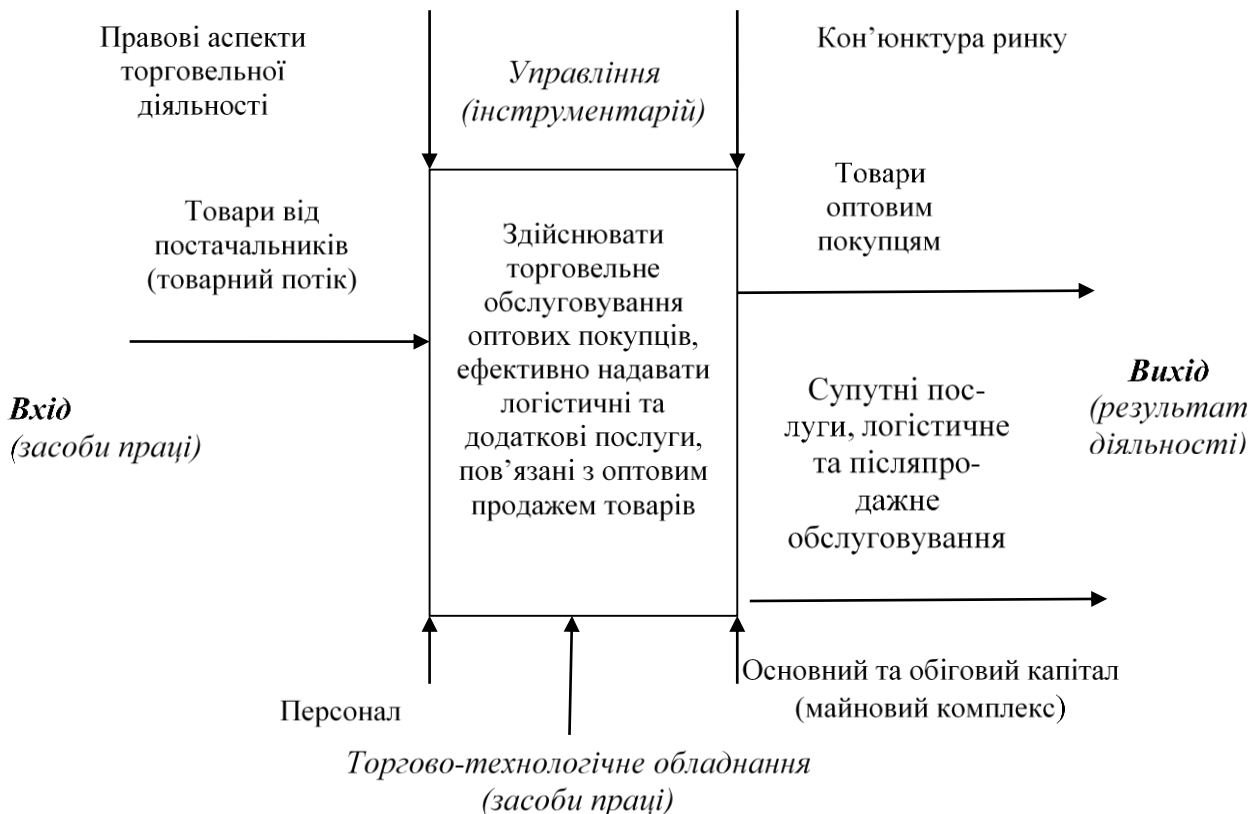
Рис. 1. Приклад константної діаграми SADT для оптового підприємства (авторська розробка)

З метою організаційного моделювання бізнес-процесів оптового підприємства пропонуємо застосувати методологію структурного аналізу та проектування систем (SADT). Базова ідея обраної методології полягає у виокремленні мегапроцесів, із подальшим їх поділом на складові процеси та підпроцеси. Останні слід зображати у вигляді поіменних блоків, які, у свою чергу, містять діаграми та від 3 до 6 функціональних блоків. Діаграма вищого рівня ("контекстна") складається з одного блоку (рис. 1).