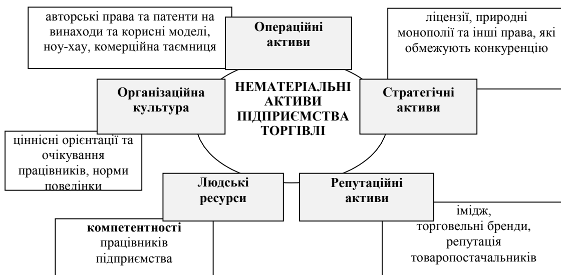
Рис. 2. Структура нематеріальних активів підприємства торгівлі

Науковці, менеджери-практики, консультанти досить вільно застосовують у контексті стратегічного управління поняття “компетенції”, “ключові компетенції”, “стратегічні активи”, “нематеріальні ресурси”. Дослідження показало, що найбільш поширеним тлумаченням категорії компетенцій, що пропонують Ф. Гуїяр і Дж. Н. Келлі у контексті ресурсної теорії фірми, є їх ототожнення з ключовими (кореневими) компетенціями як взаємопов’язаного набору навичок, здібностей та технологій, що формує унікальність підприємства у певній галузі або сфері, та може застосовуватися у багатьох видах бізнесу та галузях [7, с. 134]. Будь-яке підприємство торгівлі адаптує під власні вимоги та особливості розвитку розуміння змісту поняття “компетенція” та встановлює перелік найважливіших із них для забезпечення конкурентних переваг та стратегічної гнучкості.