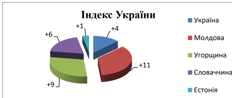
Рис. 1. Місце України в рейтингу країн за індексом конкурентоспроможності (2017/2018 рр.)

Безумовно, якщо порівняти Україну з ближніми західними сусідами (Польщею, Румунією, Чехією тощо), то ми зростаємо найповільнішими темпами. Попри це, проект бюджету на 2018 рік передбачає більш ніж 3% зростання економіки, що означає вироблення товарів і послуг на 400 млрд грн більше, ніж у 2017 році.