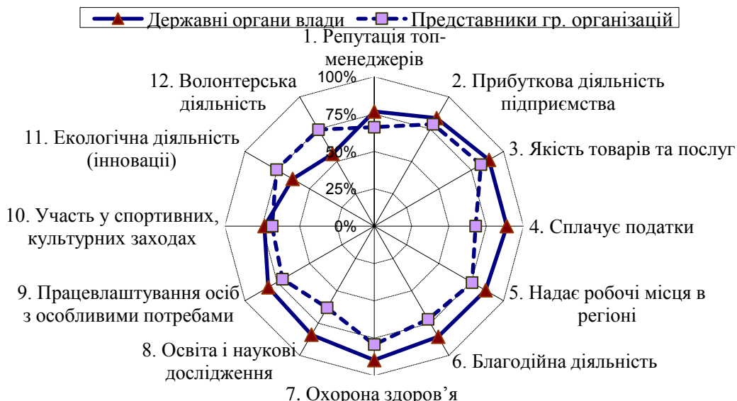
Рис. 3. Важливість соціальних детермінант привабливості у проєкціях “державні органи влади”, “представники організацій” Джерело: авторська розробка [10, с. 87]

організацій ( n=41 ) зроблено висновок, що найважливішими параметрами соціально-економічної діяльності підприємства торгівлі представники державних органів влади визнали виконання податкових зобов'язань, створення робочих місць у регіоні, соціальні інвестиції в охорону здоров'я, освіту і науку, благодійну допомогу. Представники організацій найважливішими критеріями визначили прибуткову діяльність, виконання зобов'язань за договорами поставки, впровадження інновацій для збереження довкілля, волонтерську діяльність (рис. 3).