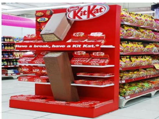
Рис. 2. Зразок оформлення корпоративного дисплея при продажу товарів імпульсного попиту

POS-матеріали, або POSM (від англ. Point of sales materials) – це елементи рекламного оформлення, що розміщуються в місцях продажу. Вони допомагають привертати увагу потенційних покупців до товару, підвищують їх лояльність та інформують їх про властивості пропонованих товарів. Найкращим видом POS-матеріалів для просування товарів імпульсного попиту є корпоративний дисплей (рис. 2), де покупцеві можна комплексно продемонструвати логотип брэнда, корпоративний стиль, вдалу викладку та підсвітку тощо. Однак у невеликих магазинах зазвичай не практикують розміщення корпоративних дисплеїв, а якщо й розміщують, то не завжди чітко дотримуються правил викладки.