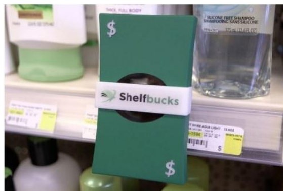
Рис. 3. Розміщення Smart POP Display біля акційного товару

Водночас слід зазначити, що в Україні, на жаль, не завжди всі пропоновані заходи втілюються на практиці, особливо в невеликих магазинах через брак місця в торговому залі. До того ж, виробники імпульсних товарів часто не мають можливості забезпечити достатню кількість додаткових місць для своєї викладки, що негативно позначається на обсягах продажу відповідних товарів. Проте сучасна вітчизняна роздрібно́я торгівля набуває максимально цивілізованих рис, від чого, безперечно, виграють як виробники, так і торговці.