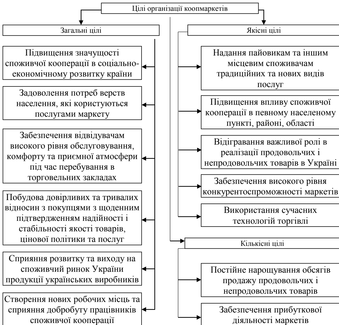
Рис. 1. Цілі організації коопмаркетів в Україні