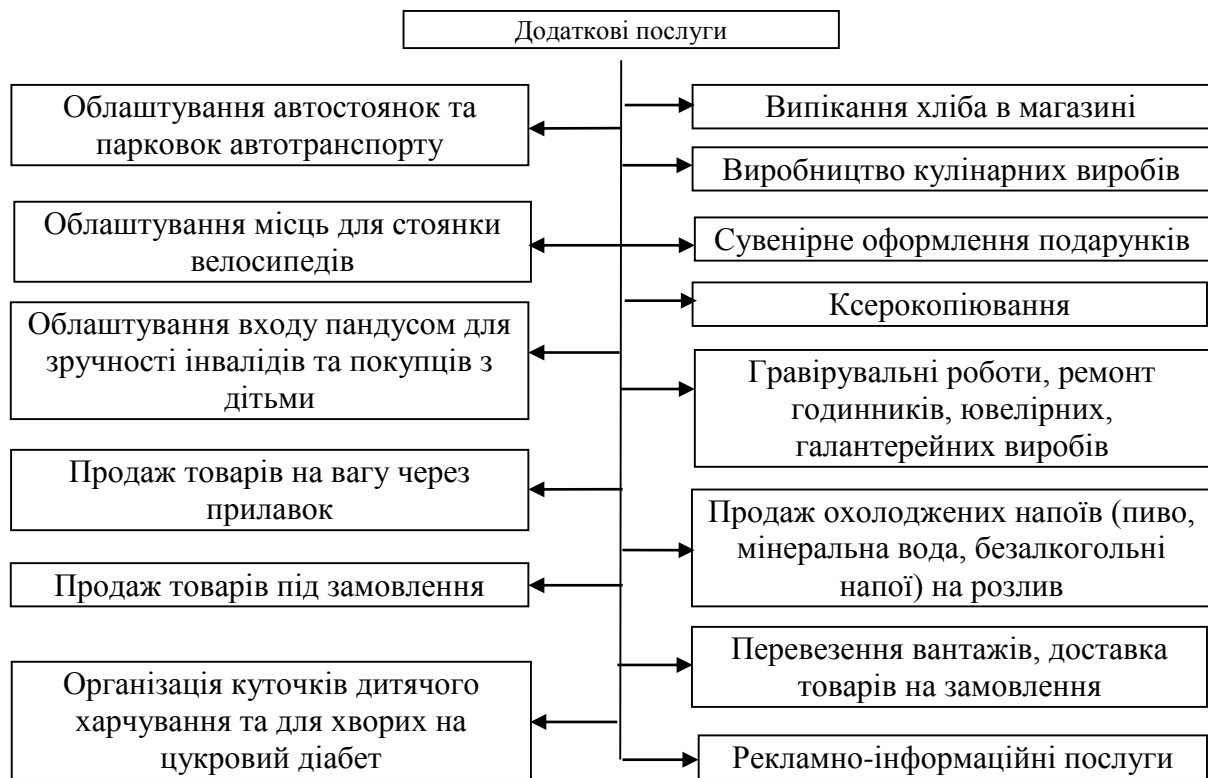
Рис. 3. Орієнтовний перелік додаткових послуг для кооперативних маркетів

На сьогоднішній день відсутні точні статистичні дані про чисельність коопмаркетів у системі споживчої кооперації України, однак, за оцінками експертів, вона складає близько 600 од. Власний аналіз показав, що, наприклад, у структурі Тернопільської ОСС діє понад 150 магазинів типу “маркет” і “міні-маркет”, Чернівецької ОСС – понад 100, Житомирської ОСС – близько 80, Львівської ОСС – 77, Кіровоградської